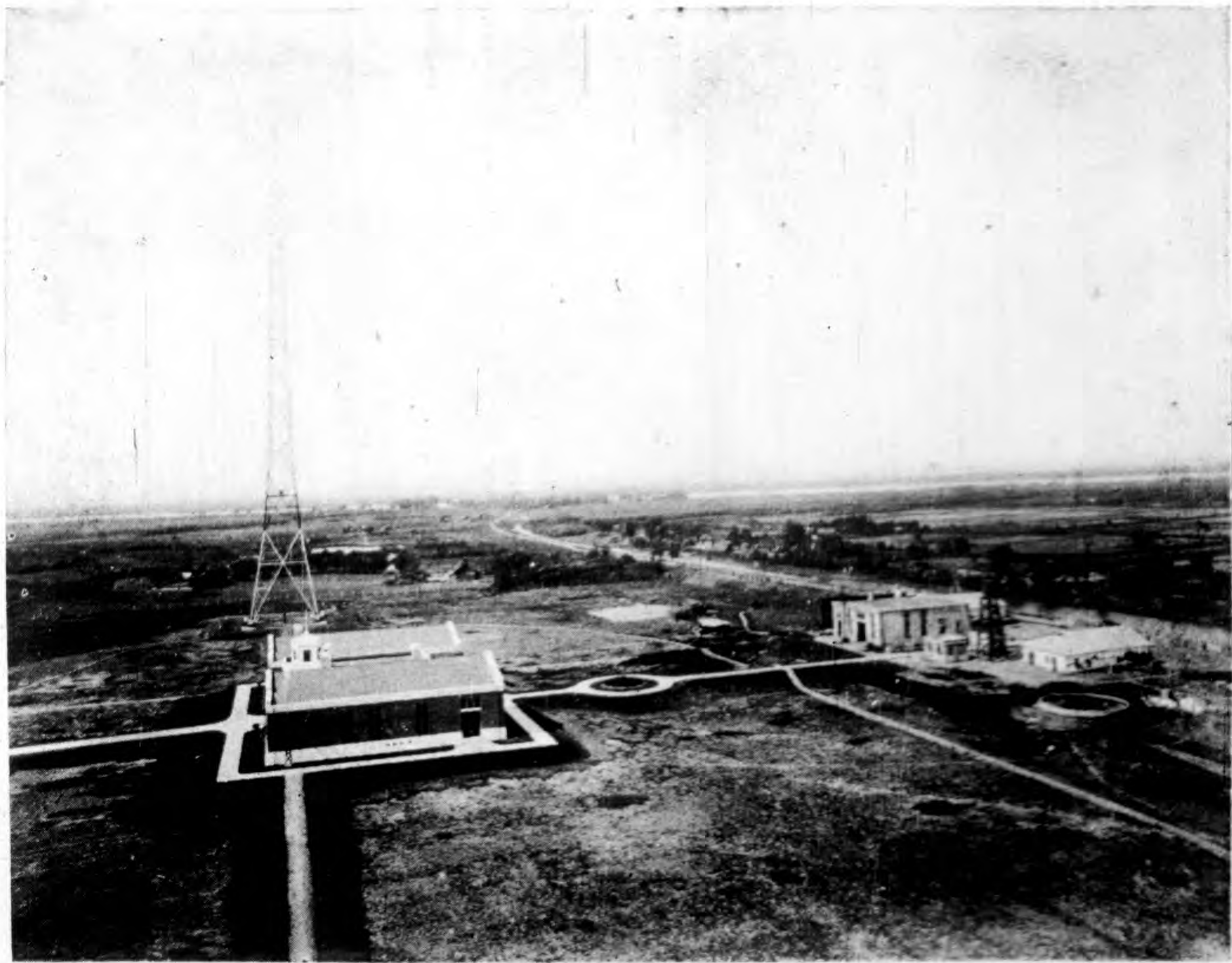
中央廣播無線電台全景(其一)