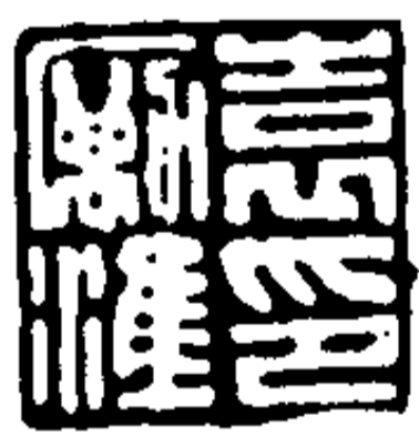
表 厲 準