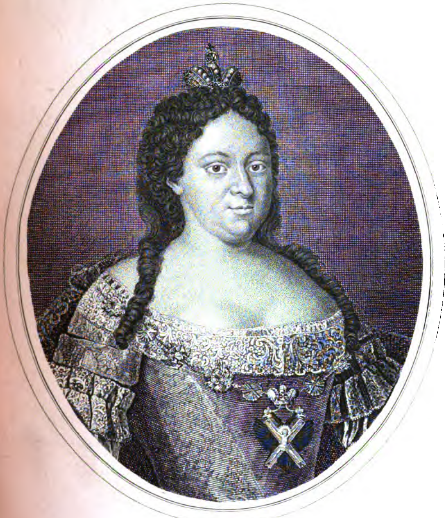
ИМПЕРАТРИЦА АННА ІОАННОВНА.