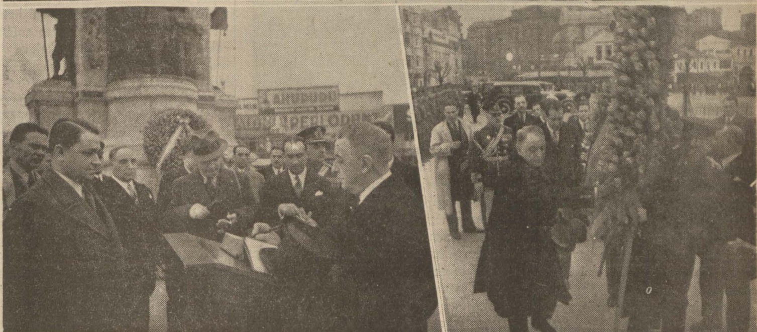
Dost Romanya Hariciye Nazırı Antonesco'nun şehrimize muvasalatından ve Taksim abidesine gelenk koyuşundan intibalar