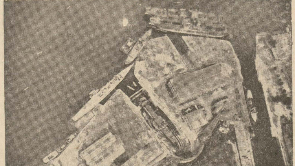
Havuzların tayarreden alınmış bir resmi

İktisad Vekâleti Deniz Fabrikalarında yeni inşaat ve tesisata bu sene içinde başlanacaktır. Enebi ve Türk müte-hasssaları Havuzların her büyüklükte gemileri inşaaya müsaide bir hale gelmesi için icab eden inşaatın ve getirilmesi için icab eden makinenin projelerini ve listelerini hazırlamışlardır. Mevcud havuzlar ihtiyacı kâfi olmadığı için sivil tersanemiz Hasköye kadar tevsi e-