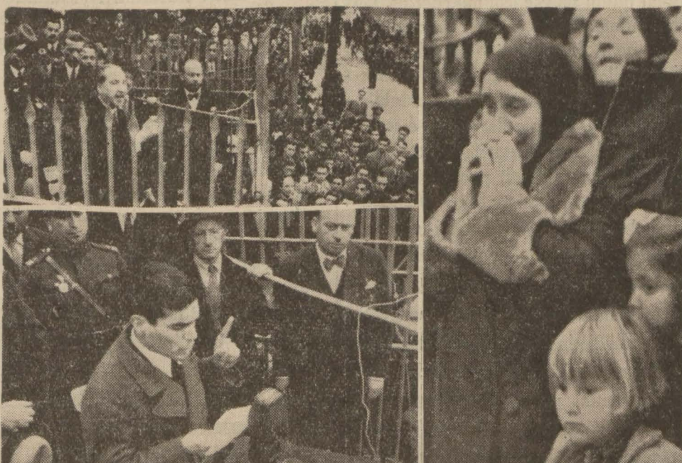
16 mart şehidleri için dün Eyübe yapılan merasimden intibalar

Yataklarında uyurken kahpece şehid edilen bu kahramanların hatıraları göz yaşlarıyla anıldı