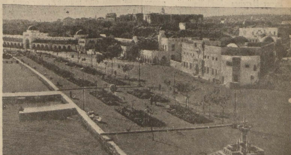
Rodos adasından bir manzara

Adalar halkına ve bilhassa Rum ahaliye geniş haklar veriliyor