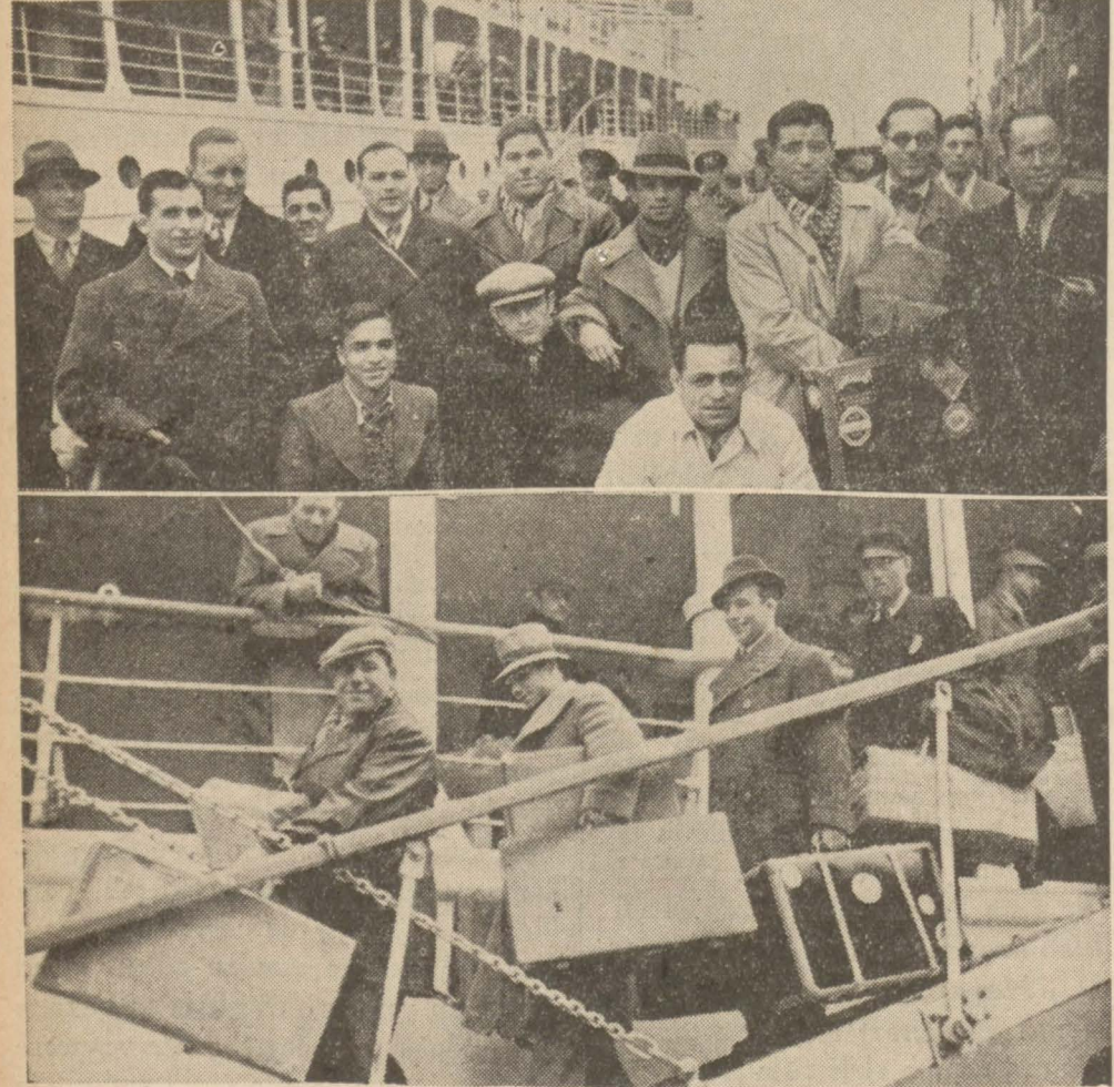
Finlandiyadan gelen güreşçilerimiz vapurdan inerlerken

Finlandiya ve İsveçte muvaffakiyetli müsabakalar yapan pehlivanlarımız, çok memnundurlar