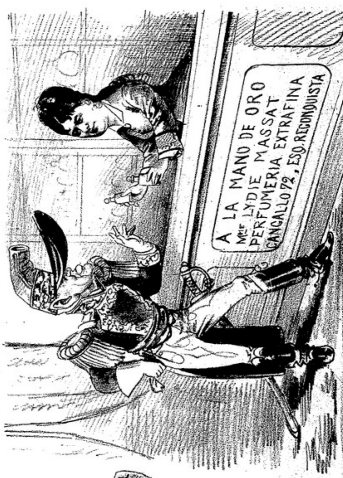
— Señora, me han dicho que en su tienda se encuentran los perfumes mas exquisitos. — Es cierto. Señor General, tengo los perfumes mas a propósito para los militares que como yo tienen que llevar botas granaderas y han hecho con ellas muchas campanas, siempre como yo.