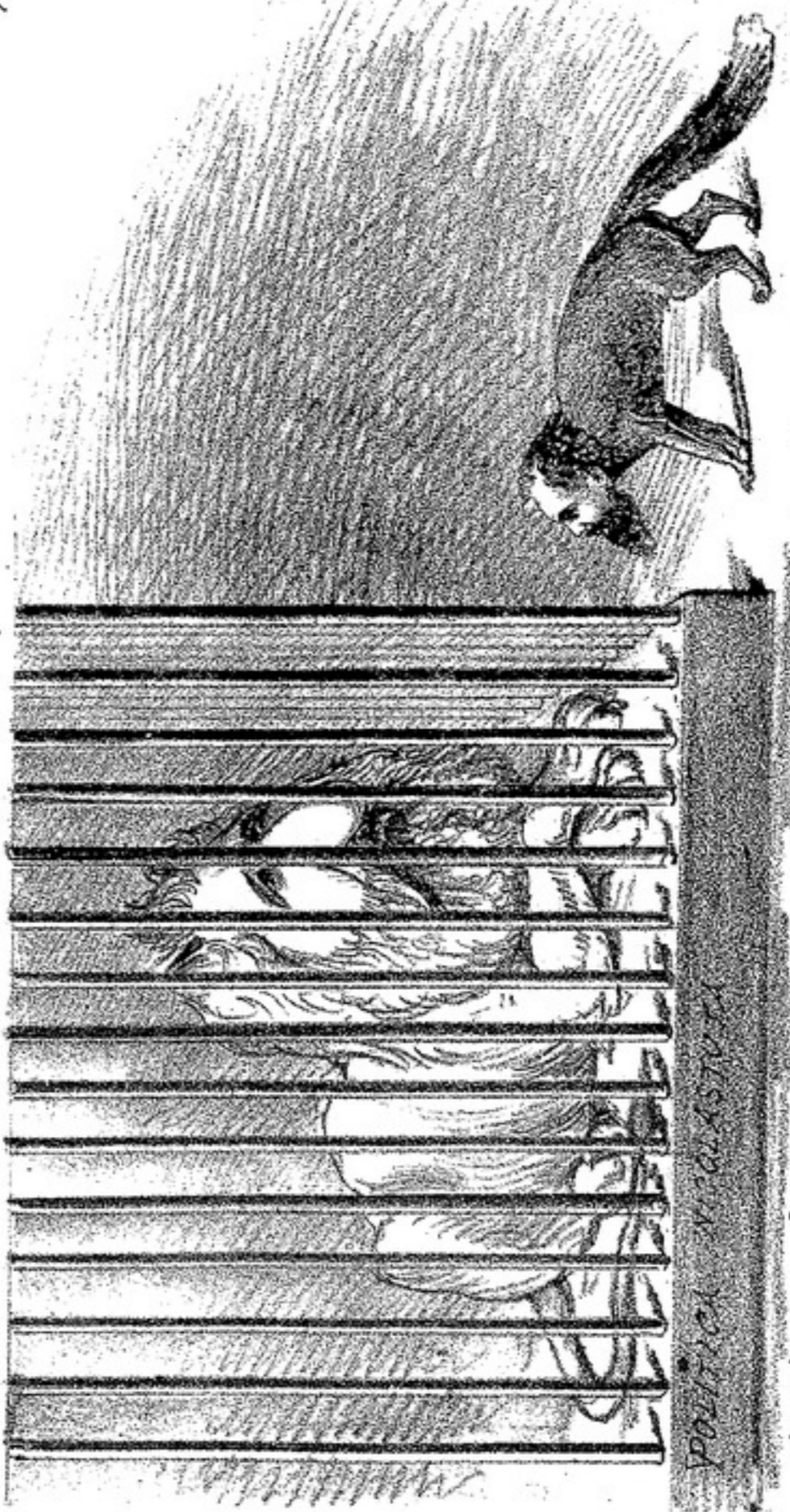
NICOLAS— Los leones se parecen a los paros en lo lónico. Mas vale ser astuto que fuerte.