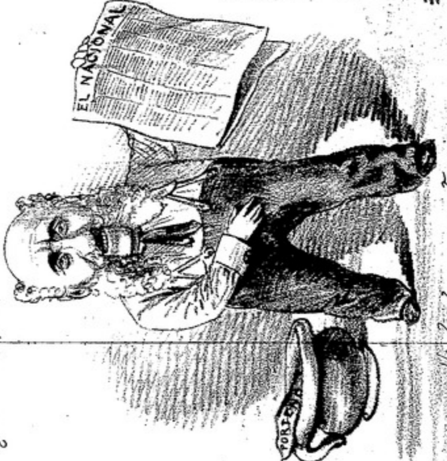
— Me leído con atención Mi retrato insperado Y por poco he reventado De una gran indignación.