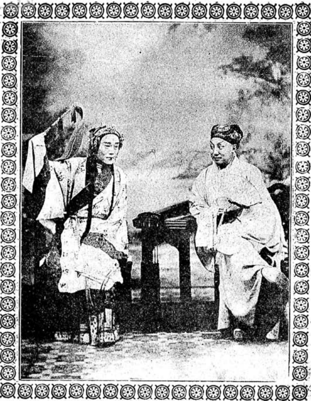
◀ 挑琴之霖德陳仙楞王 ▶