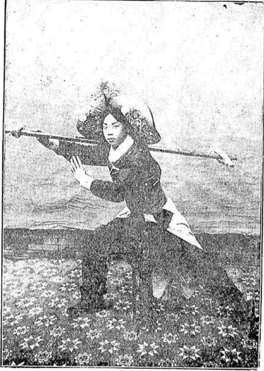
◀ 崑戲武生朱小義之探庄 ▶