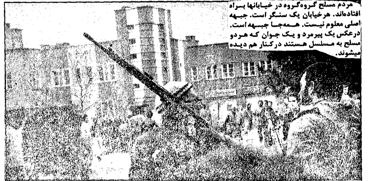
مردم مسلح گروه گروه در خیابانها پسران افتادمانند. هر خیابان یک سنگر است، جبهه اصلی معلوم نیست. همهجا جبهه است. در عکس یک پیرمرد و یک جوان که هر دو مسلح به مسلسل هستند در کنار هم دیده میشوند.