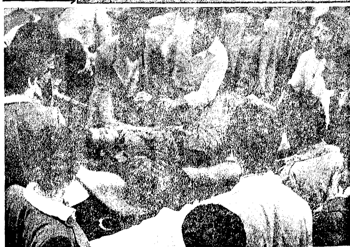
یک سرباز گارد مجروح را به بیمارستان بوعلی منتقل کرده‌اند. مردم و کارکنان بیمارستان او را بصره به اتاق عمل می‌برسانند.