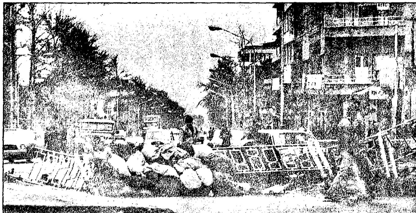
تهران از پریشا، جبهه بزرگی شد که در آن نبرد بی‌امانی ادامه داشت. اینجا و آنجا، هر جا که شد، مردم با هر وسیله‌ای در دسترس، بود سنگر بستند. عکس ضلع جنوبی میدان ۲۴ اسفند را نشان میدهد که مردم در آنجا سنگر بستند.