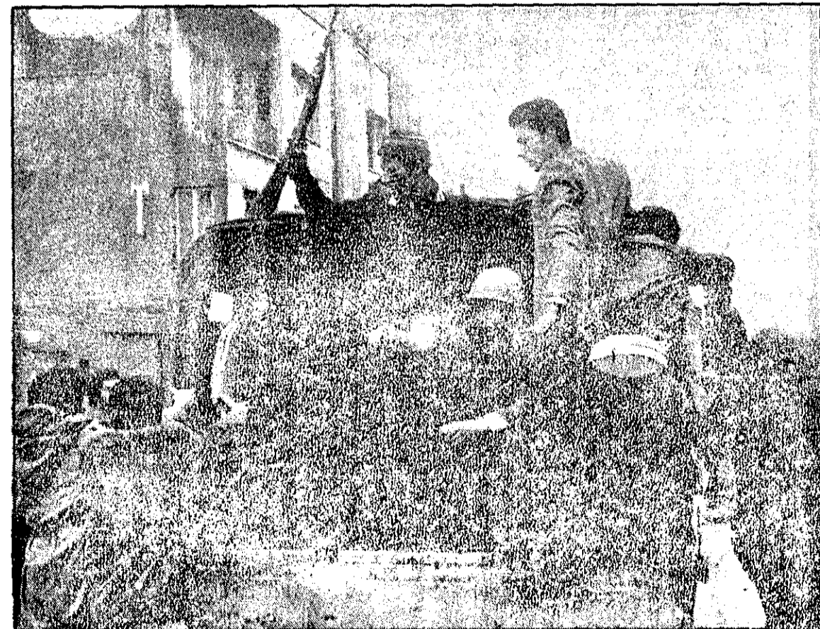
افراد نیروی هوایی همراه با مردم مسلح در یک اتومبیل نظامی نشستهاند دیگران برای دست آوردن اسلحه میخواستند با اتومبیل به شرق تهران بروند

مجاهدین خلق، چریکهای فدائی خلق چریکهای فدائی منشعب، افراد مسلح حزب توده در نبردهای مسلحانه نقش فعال دارند