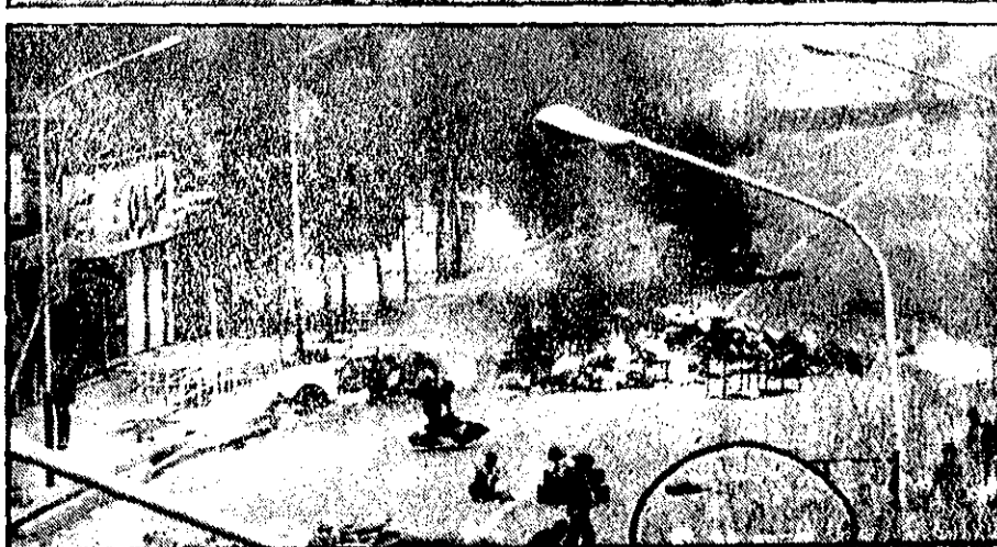
سنگر بندی - اینجا خیابان فرح‌آباد است. سرتاسر خیابان را مردم با کیسه‌های شن سنگر بندی کرده‌اند. در فاصله دو سنگر گشتی، سنگری از آبی با شده است. فرح‌آباد، دیروز یکی از محکمترین سنگرهای مردم بود.

هشدار عرفات: آمریکا برای درهم شکستن انقلاب ایران کوشش می‌کند بهر وقت خبرگزاری فرانسه - مساعی عرفات، رهبر سازمان آزادی‌بخش فلسطین در روز شنبه از آیت‌الله خمینی و پیروان او خواست تا به وحدت احتیاط کنند زیرا آمریکا و صیقل آن کوشش‌های خود را برای درهم شکستن انقلاب ایران متعزز کرده‌اند. عرفات در پیامی خطاب به رهبر انقلاب ایران، در همین حال اظهار اطمینان کرده که مسکن ایران آن توانایی را دارد که وضع مشکلات را از سر راه برداشته و برداشته خود، که دشمنان بهشت فلسطین و است هرب نیز هستند، فالی آید. پیام عرفات، نخستین پیام او خطاب به آیت‌الله پس از بازگشت او به ایران است و دیروز در بیروت حس می‌کنیم که لحظه آزادی آسان می‌داند.