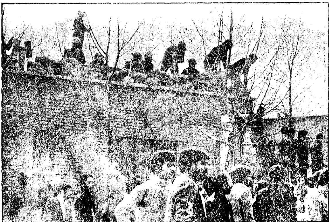
اینجا چند قدم بیشتر نماند که نیروی هوایی فاصله ندارد. سربازان نیروی هوایی و مردم هر پشت بامی سنگر گرفتند و سیل مردم در کوچه و خیابان ایستاد ماند.