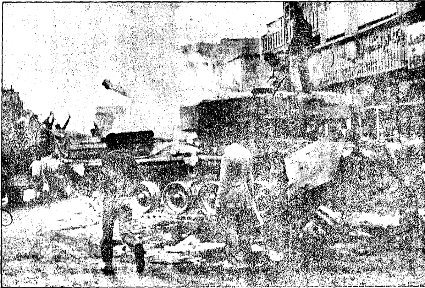
مردم دوتانک را منهدم کردهاند امروز لاشه تانکها در خیابانهای تهران اینجا و آنجا، جلب نظر میکند، درحالیکه از روی آنها دود و آتش برمیخاست، جوانها بر روی آنها شعار میدادند.

کیمهان تک شماره - ۱۵ ریال یکشنبه ۲۲ بهمن ۱۳۵۷ - ۱۳ ربيع الاول ۱۳۹۹ - شماره ۱۰۶۳۵