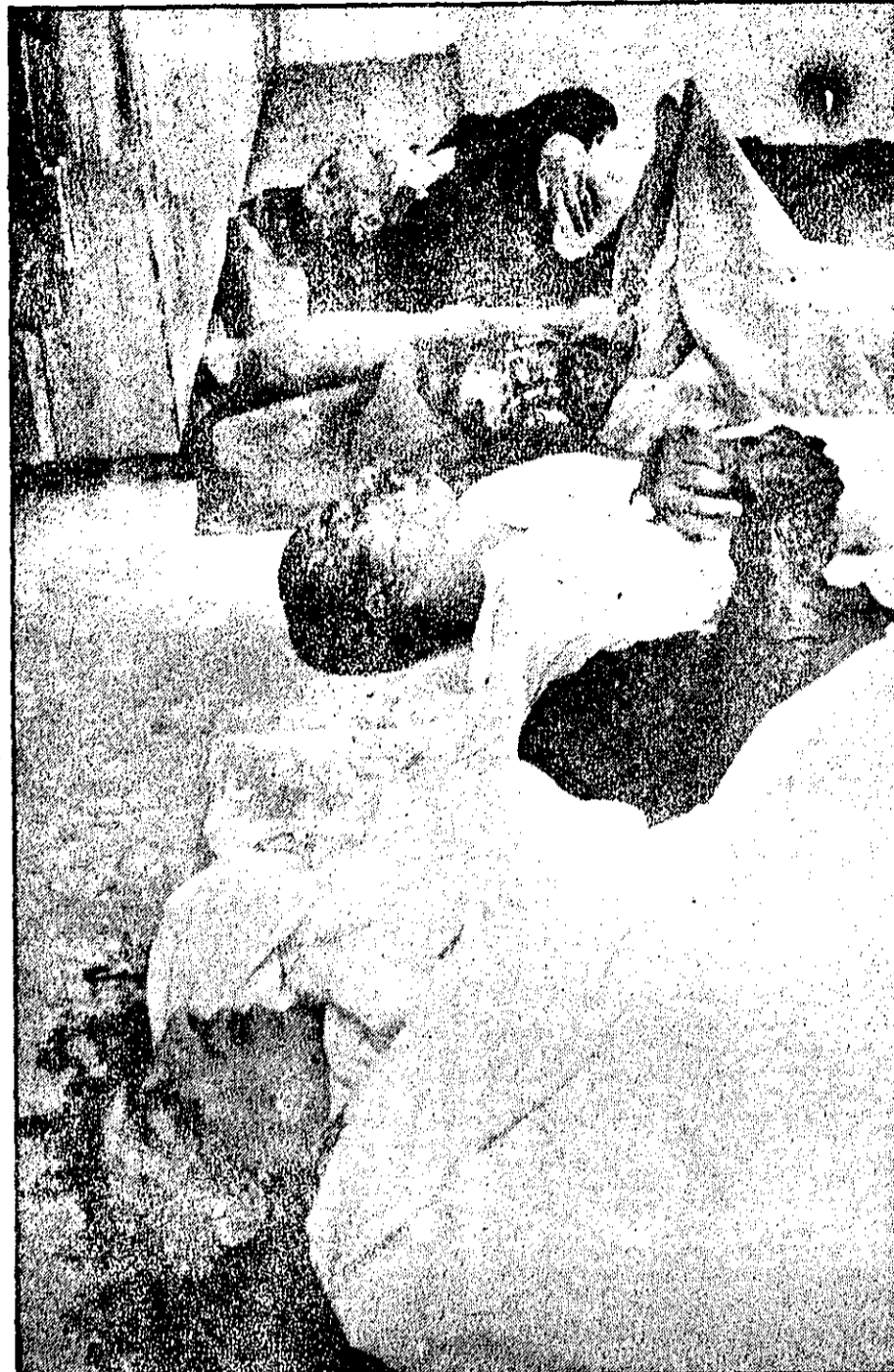
این عکس از سردخانه بیمارستان بوعلی گرفته شده. ۳ سرباز و یک پیرمرد در سنگر آزادی جنگیدند و در خون مردمی خویش فرو غلتیدند.