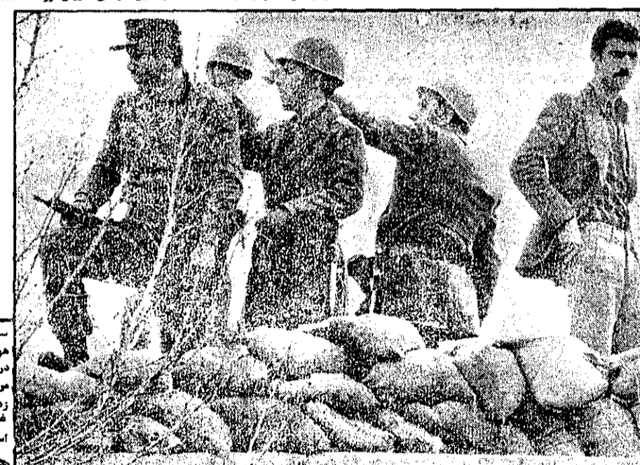
سنگر بر پشت‌بام - چند سرباز نیروی هوایی بر پشت‌بام خانه‌ای در فرح‌آباد در پشت سنگری از کیسه‌های شن که مردم فراهم کرده‌اند، پمپله بندی زد و مورد را تدارک می‌بینند. یک عضو نظامی هم در سنگر ایستاده است.