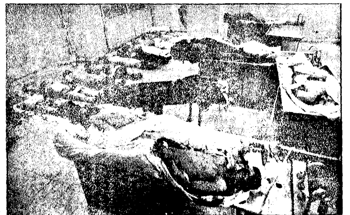
تعدادی از مقتولین نبردهای خونین تهران در سردخانه پزشکی قانونی. تعداد تلفات بسیار سنگین است