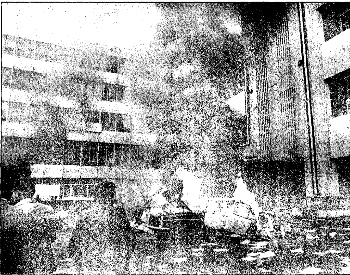
قرارگاه پلیس در میدان توپخانه به تسخیر مردم درآمد. انجمن‌های پلیس در خیابان فرارگاه در آتش میسوزد. مردم می‌گویند: سربازان قبل از فرار قرارگاه و انجمن‌ها را به آتش کشیدند.