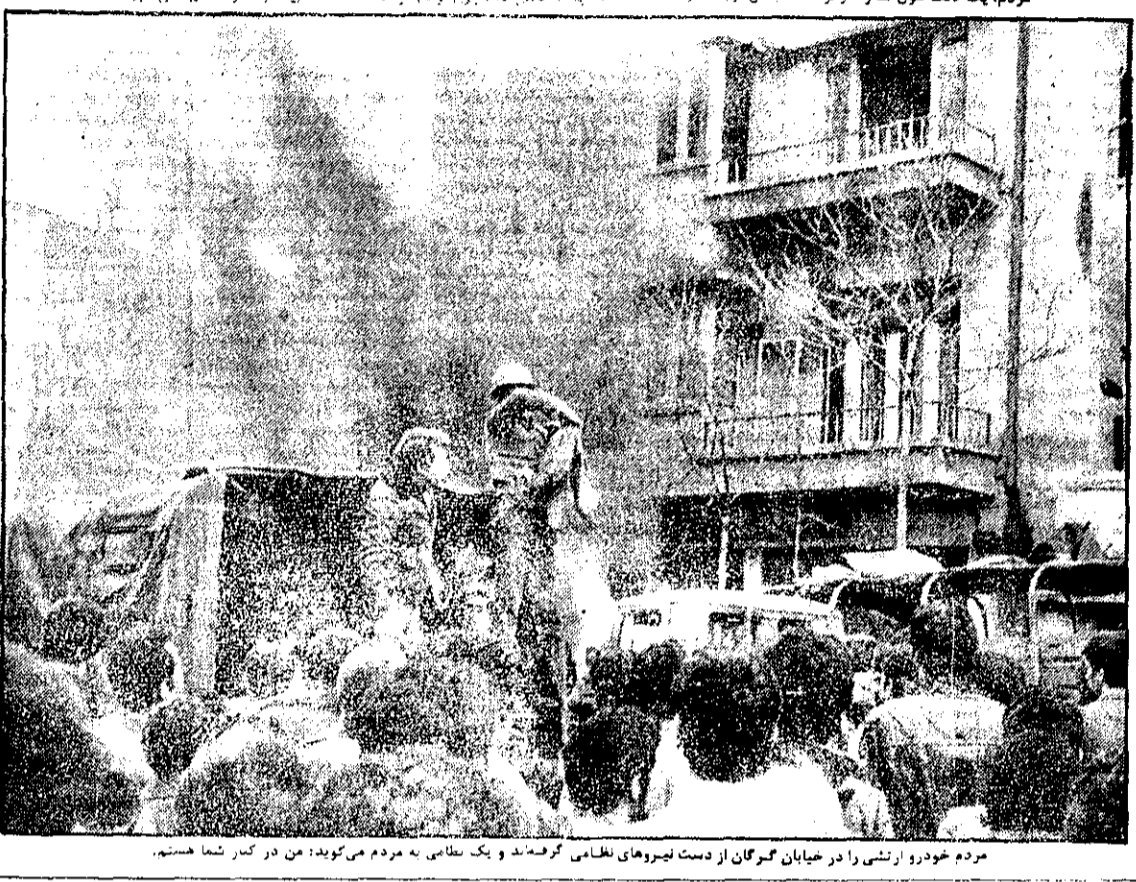
مردم خود را از خیابان گران از دست نیروهای نظامی گرفتند و یک نفر کشته شد...

ساعت ۸:۵۰ پادامه امروز یکی از افراد نیروی هوایی و یک غیرنظامی مسلح در نوارمک با خبرنگار ما که در منطقه تهران و مستقر است، گفتند: ساعت ۳ بعد از ظهر دیروز ما (نیروهای ضربه‌ای) به کلاتری نوارمک حمله کردیم. افراد داخل کلاتری در آقا مقاومت کردند ولی یکم غنیمت شدند و در ساعت ۷ بعد از ظهر کلاتری سقوط کرد. این دو نفر ادا کرده که ۷ نفر از افراد پاس کشته و ۳ نفر دیگر تسلیم شدند. چندین قبضه سلاح بر سر او ایستاد. مسلسل دوازده ساخت اسرائیل در کلاتری پست آمد.