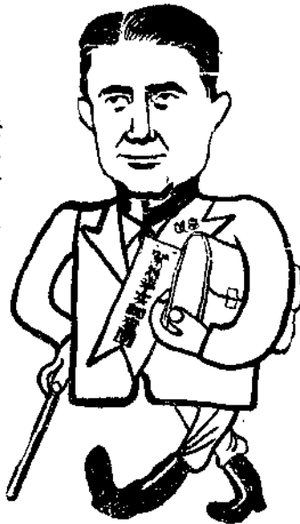
魏 德 邁