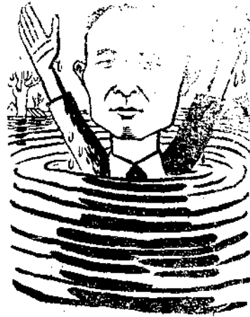
薩 鎮 冰