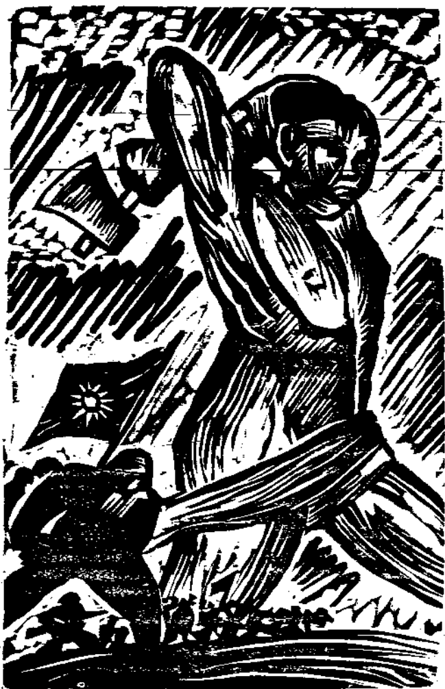
向敵軍人報去！——愷之作