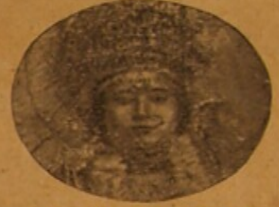
দেবী মহামায়া : সাবিত্রী