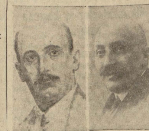
Çiftçi Fırkası Reisi M. Papanastasio

Türkiye ile anlaşma si-yasetini tasvip ediyorlar