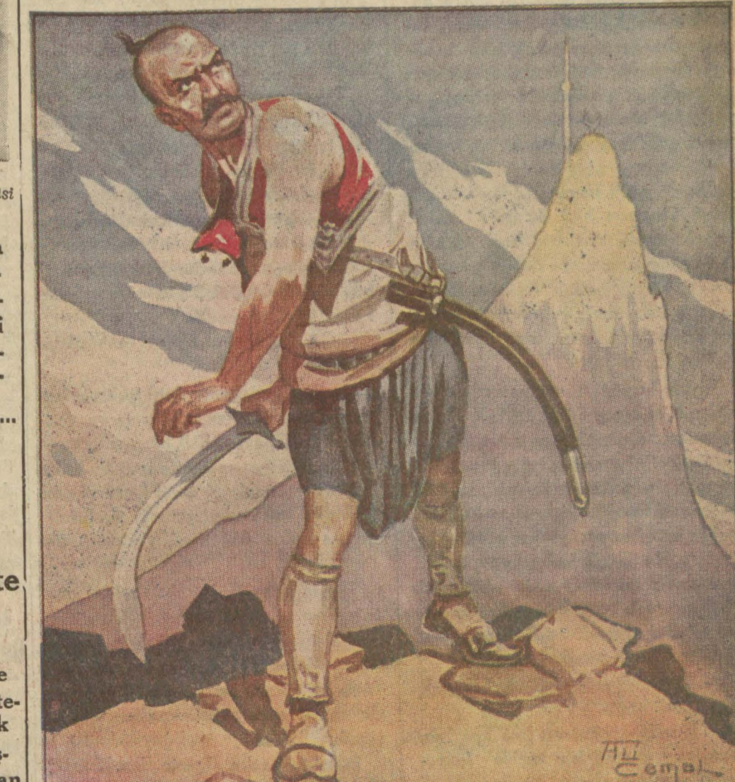
«Olup Yeniçeri çektim cefayı * Piyade eyledim nice gazayı» Koca Mimar Sinan [İkinci sahifede takip ediniz]