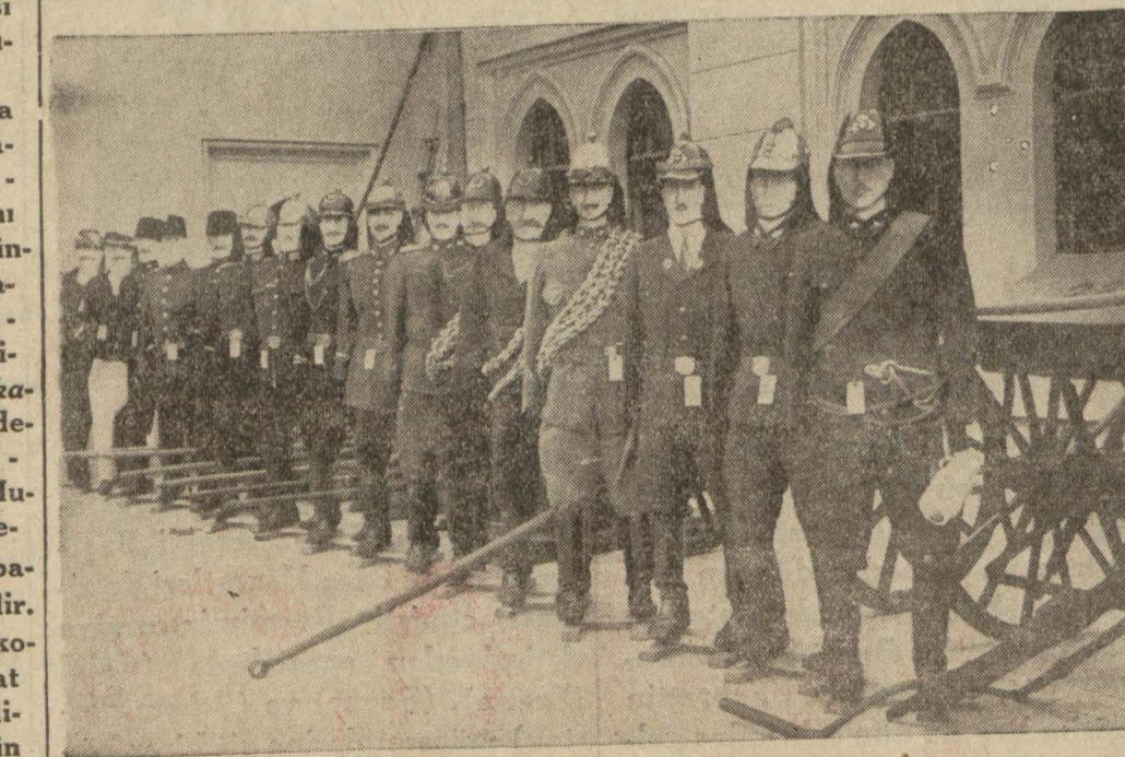
217 senedenberi muhtelif devirlerde itfaiyemizin kıyafetini gösteren mankenler