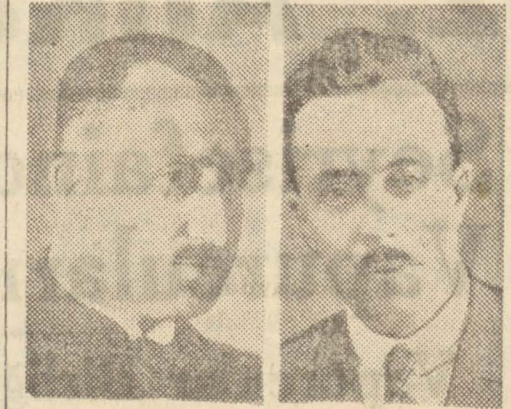
Reşit Saffet B.