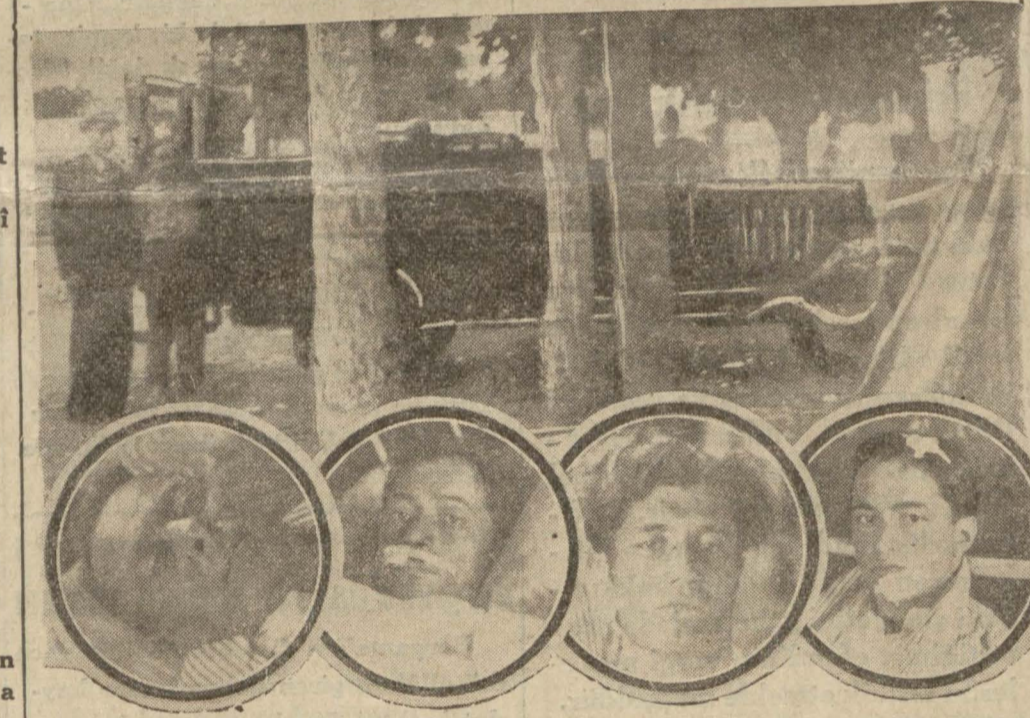
Kazayı yapan otobüste yaralanıp Haydarpaşa hastanesinde tedaviye alınanlardan bazıları

Kaza Suadiye yolunda oldu, biri ağır olmak üzere 17 kişi yaralandı