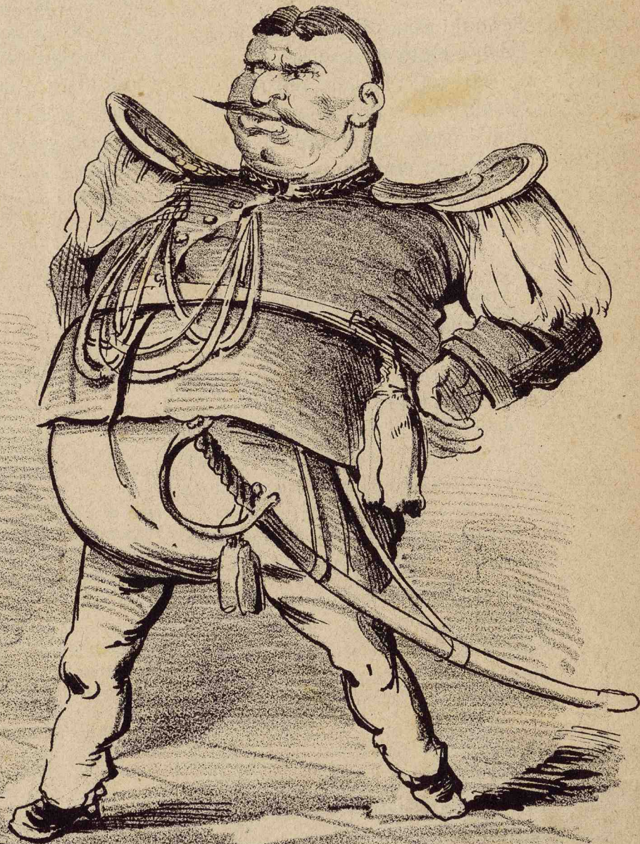
Cum era intendentia inainte de resbelu