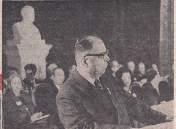
آکادمیسین شقوروف، رئیس انستیتوی خاورشناسی فرهنگستان علوم اتحاد شوروی و میزبان کنگره ایران شناسی لنین گراد