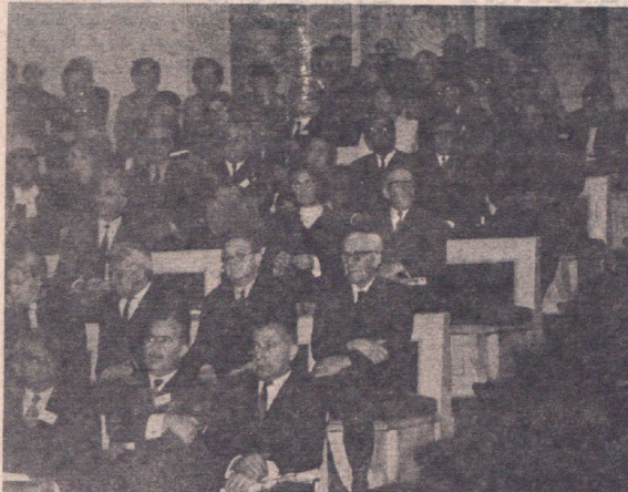
گوه‌های از کنگره ایران شناسی لنین گراد و تعدادی از دانشمندان شرکت کننده

دانشمندان اتحاد شوروی عضو کنگره تاریخ و فرهنگ ایران از دانشمندان برجسته ایرانی و از دانشمندان اتحاد شوروی که برای برگزاری این سالگرد تاریخی ایران در این کنگره شرکت خواهند کرد، بسیار سپاسگزاریم و امیدواریم مجموعه سخنرانیهای که در کنگره ایراد خواهد شد امکان آن دهد که گفتگوهای علمی و فرهنگی بین ایرانیان و روس‌ها در زمینه تاریخ و فرهنگ ایران و اتحاد شوروی و نمایشگاه آسار هنری و باستانی ایران در موزه ارمیتاژ لنینگراد شوروی گشایش یافته است. در این کنگره هزار نفری، دانشمندان سراسر شوروی و خارجی و هیئت از دانشمندان ایرانی شرکت داشتند.