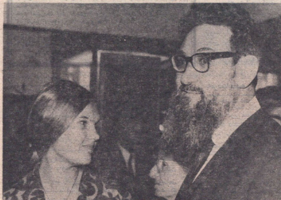
بلتیسکی دانشمند ایران شناس شوروی

هفته گذشته، کنگره تاریخ و فرهنگ ایران و نمایشگاه آسار هنری و باستانی ایران در موزه ارمیتاژ لنینگراد شوروی گشایش یافت. در این کنگره هزار نفری، دانشمندان سراسر شوروی و خارجی و هیئت از دانشمندان ایرانی شرکت داشتند.