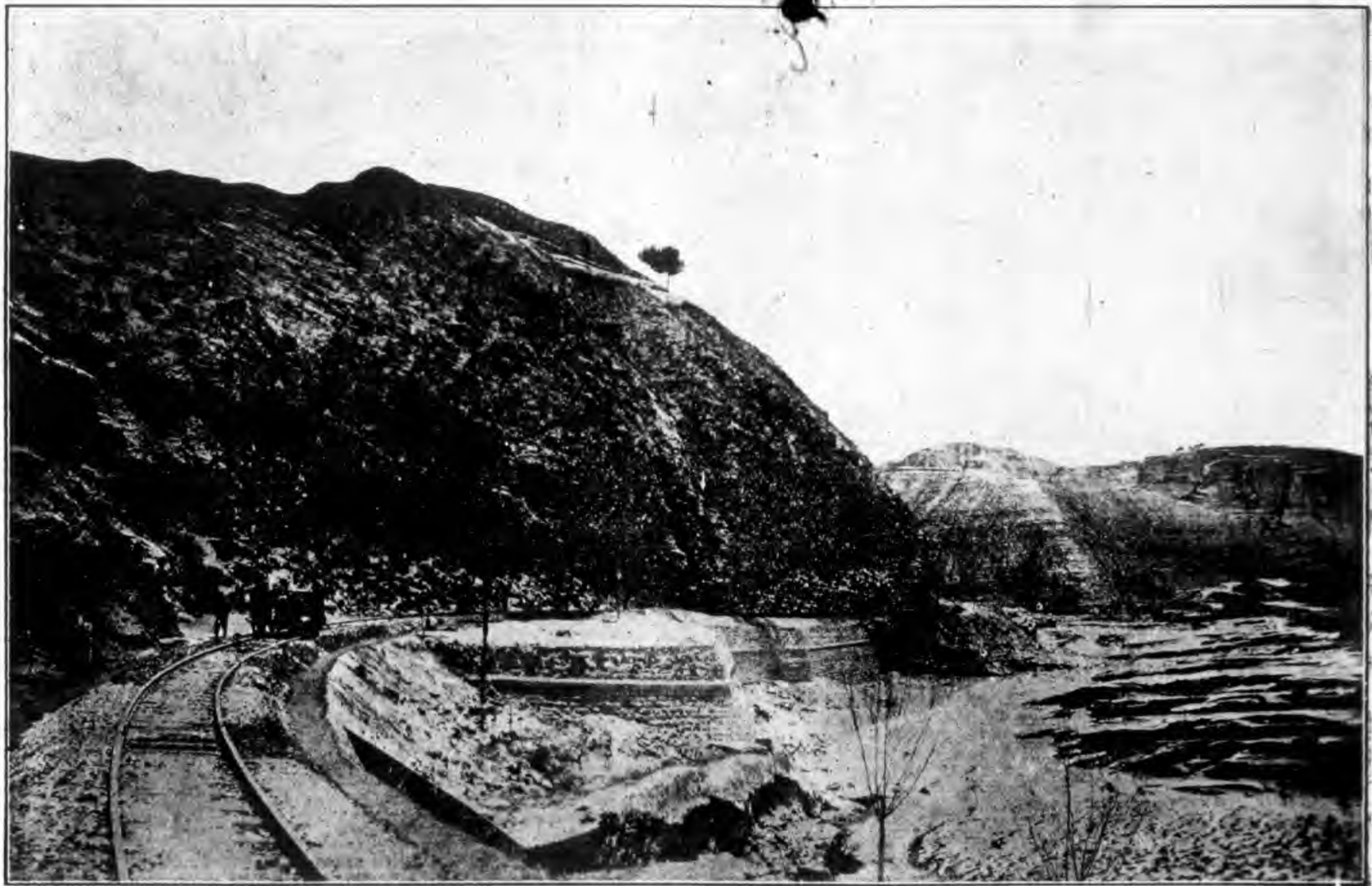
本路一百七十七公里之處灣道