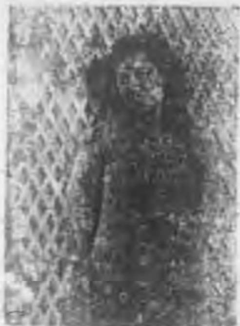
十五 影近姐小華燕李

這就是植物的生命過程，也是我們生存的基礎。植物提供的營養物質，是人類和動物賴以生存的源泉。