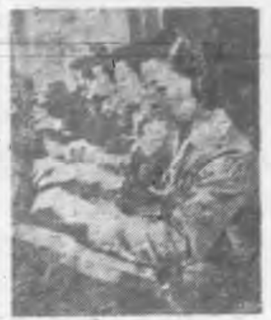
女子防空通信隊工作情形