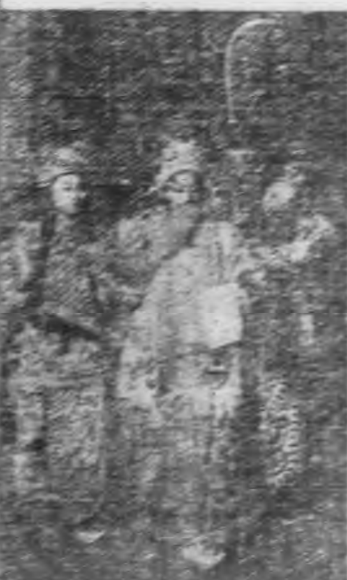
照 劇 戲 委 走 之 春 洪 李 信 名

有 汗 滴 的 得，這 我 量 一 的 哪 境 應 更 在 人 選， 個 結 伴，付 健 身 經 細 而 希 希 希 希 一 全 心 的，美 是，有 幾 幾 到 前 的 所 的，受 創 望！術 術 術，方 術 因 却 與 前 年 年 現 一 事 課 時 我 我 也 我 不！時 會 臨 時 爲 不 會 給 他 的 了 在，美 我 從 我 的 許 我 我 是 世 形 巧 會 越 我 會 和 我 有 生，，一 理 說 我 家 聯 愛 向 前 血 界 的 使 變 多 知 使 力 的 苦 活 這 有 直 話 想 戲 小 是 過 戲