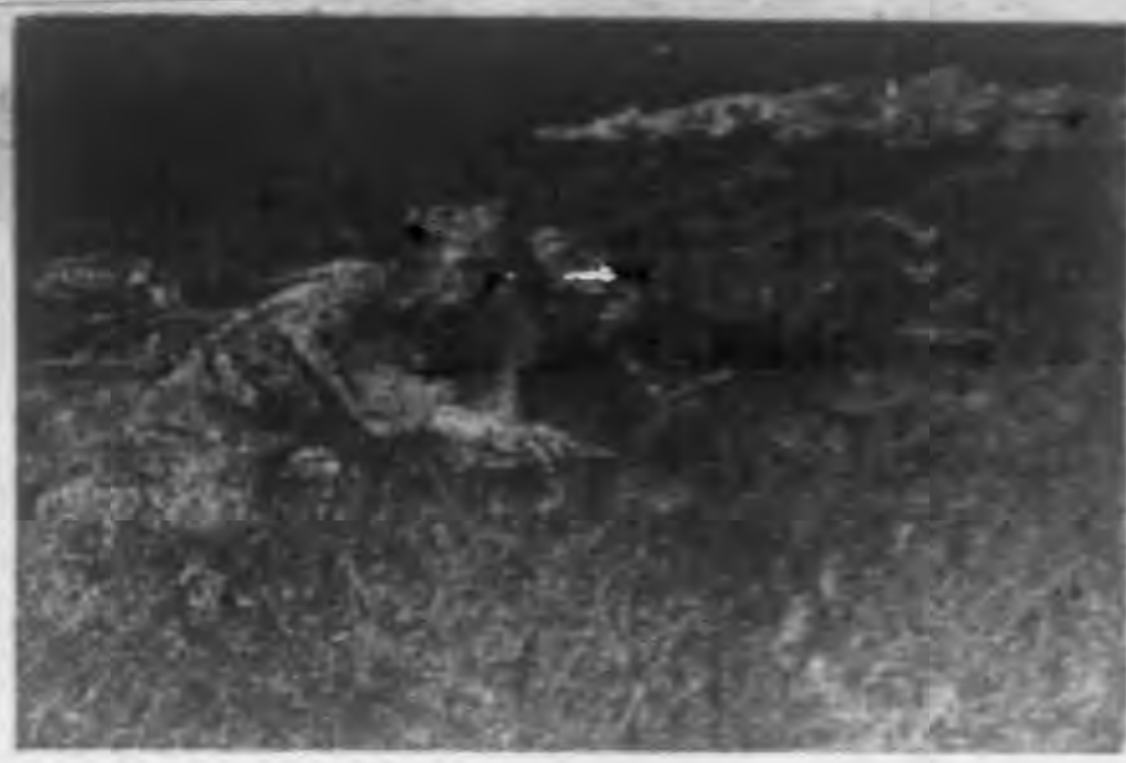
德意志青年軍的事實