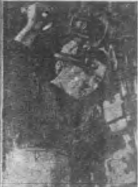
航空機製作場女子的工作