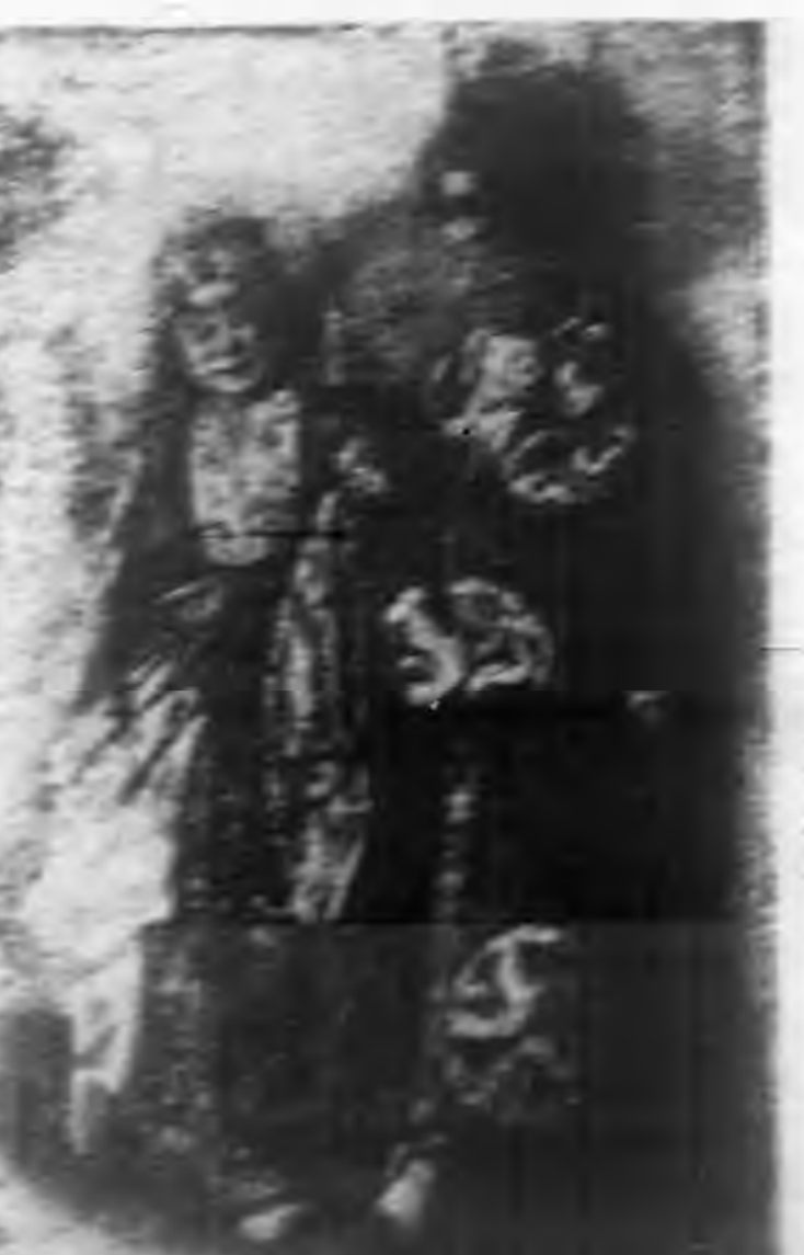
會 雙 奇 之 幸 世 徐 芳 麗 湯

下 我 反，。我 解， 戲 永，也 但 以 熟 他 但 劇 區 然 許 理 完 愛，我 ！ 請 我 會 想 成 着 喜 類 奮 我 不 與 總 我 談 愛 漫 鬥 的 灰 事 是 的 唱 他 慢 的 理 心 實 理 理 一，的 想，想 想 想 想 想 想