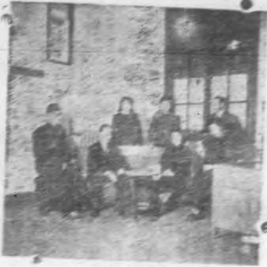
↑新開辦的 社務部 正忙於 整理 我們的 新事業