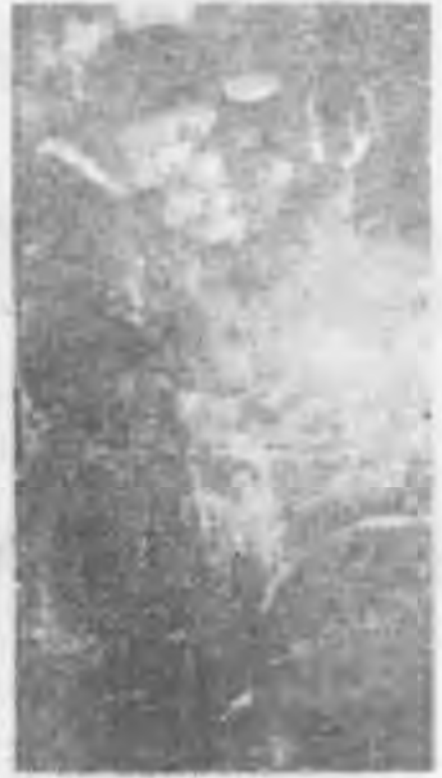
女子防空通信隊工作情形