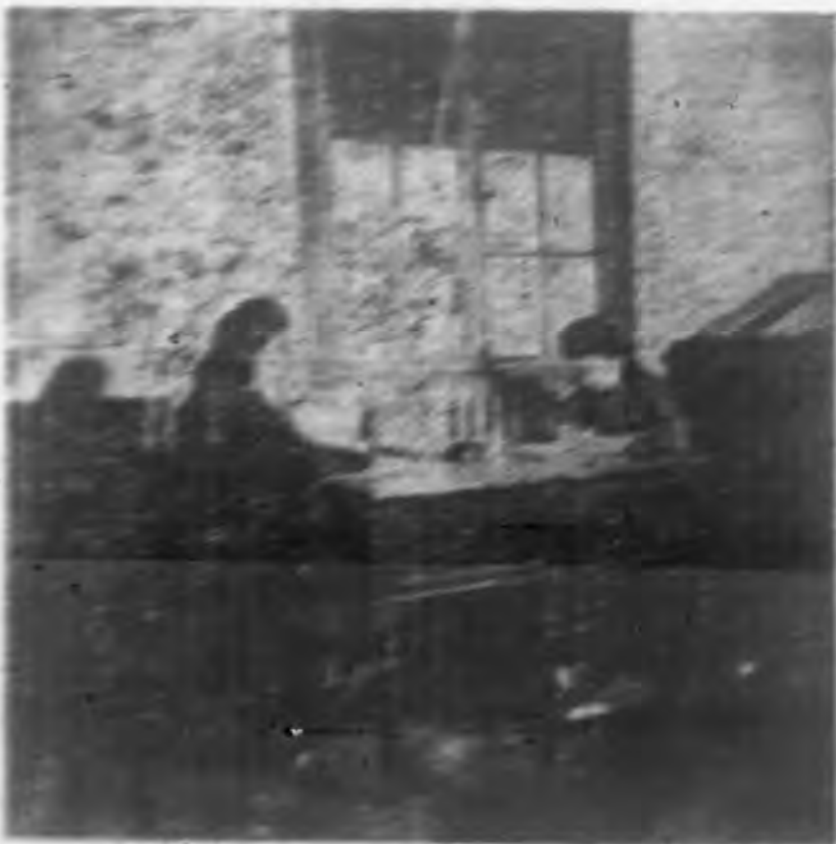
↓編輯部是工作緊張