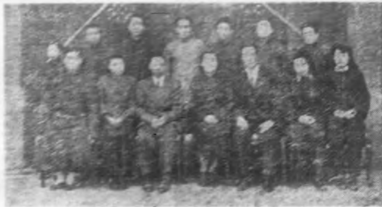
全體社員門前合影