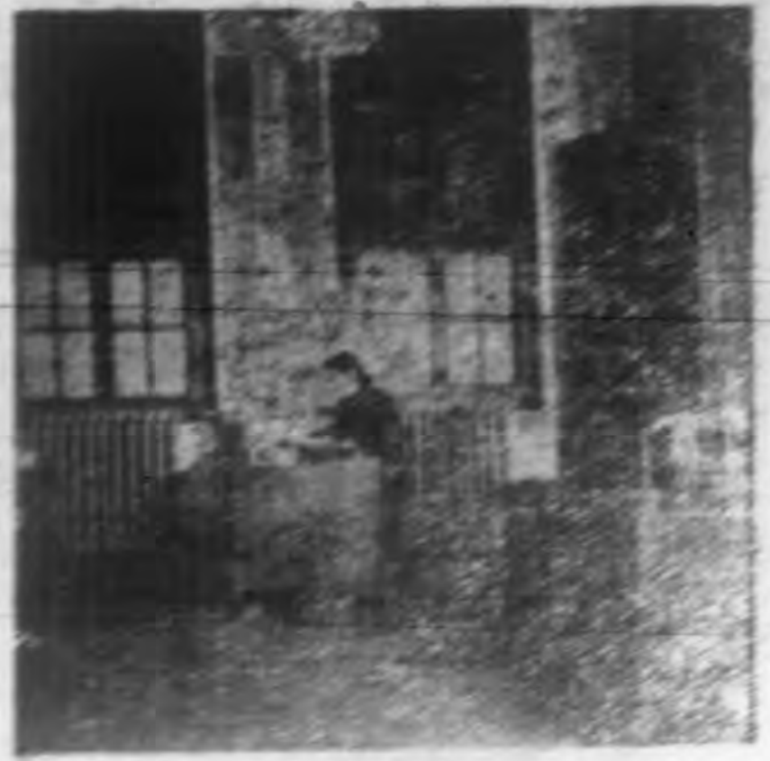
↑社長辦公室之一角