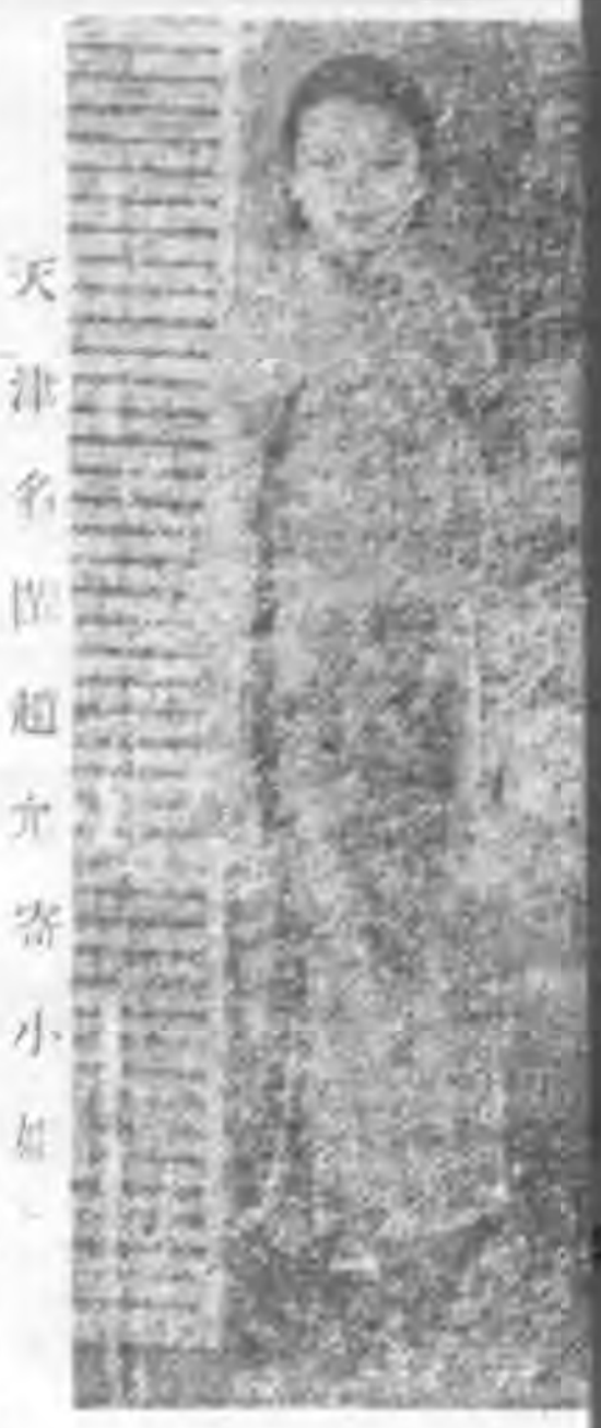
天津名世超立寄小