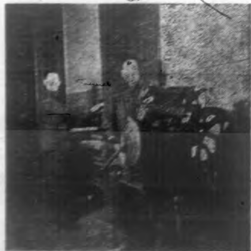
←快印吧，明天就要發行了呢。（印刷部之一角）