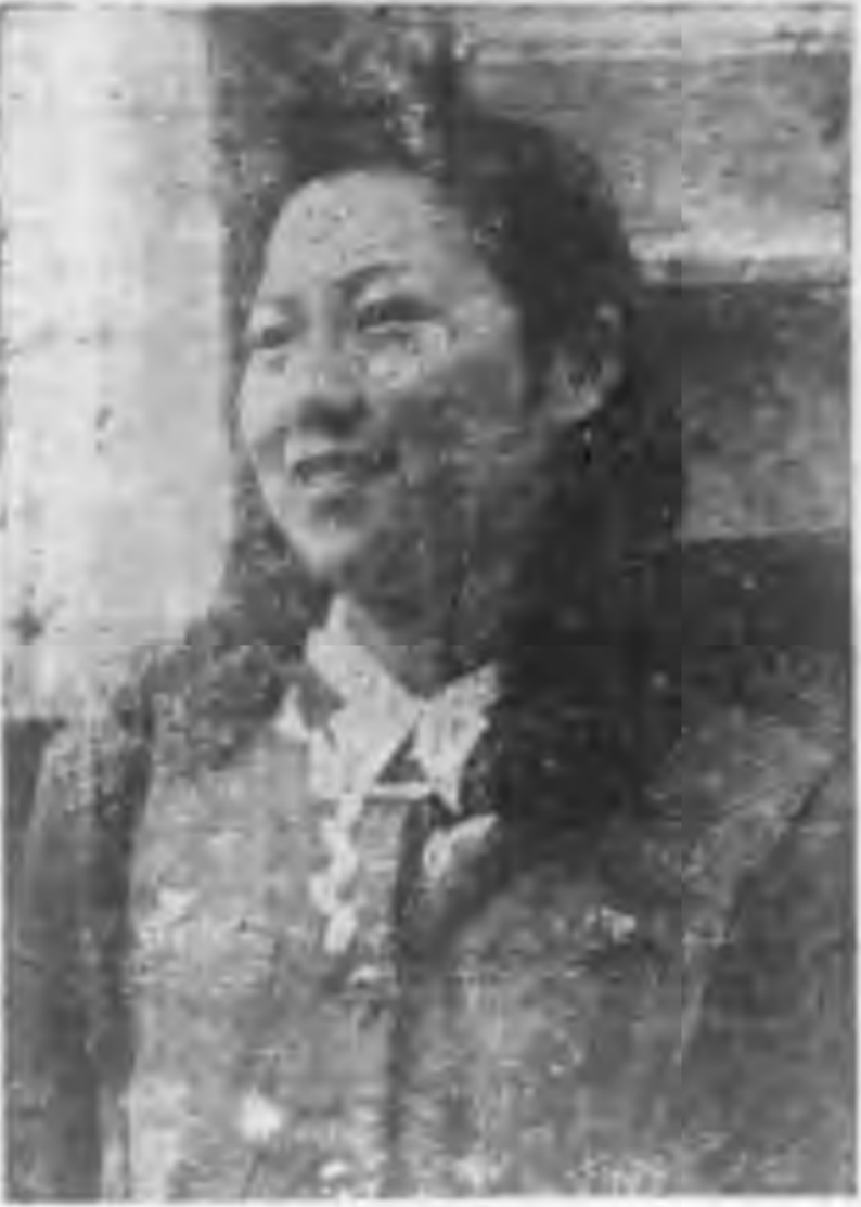
組小民節玉開名京北

頭千境所，光極望民升水的不一是一肯即... 的午運以女真捷反的智高準高易的因均使... 一乘動，人虛增增事識，也了或緣爲首真... 作中一這們榮，加情是本不女功故一苦正... 好國原一之，頭了，件來得子，，勢尋有一... 事女是婦屬向歸一誰很提不的口結小的一... ，性替女師浮不些知可高隨教就果力，兩... 可出數解，華清目這期國之育咸也單可個，