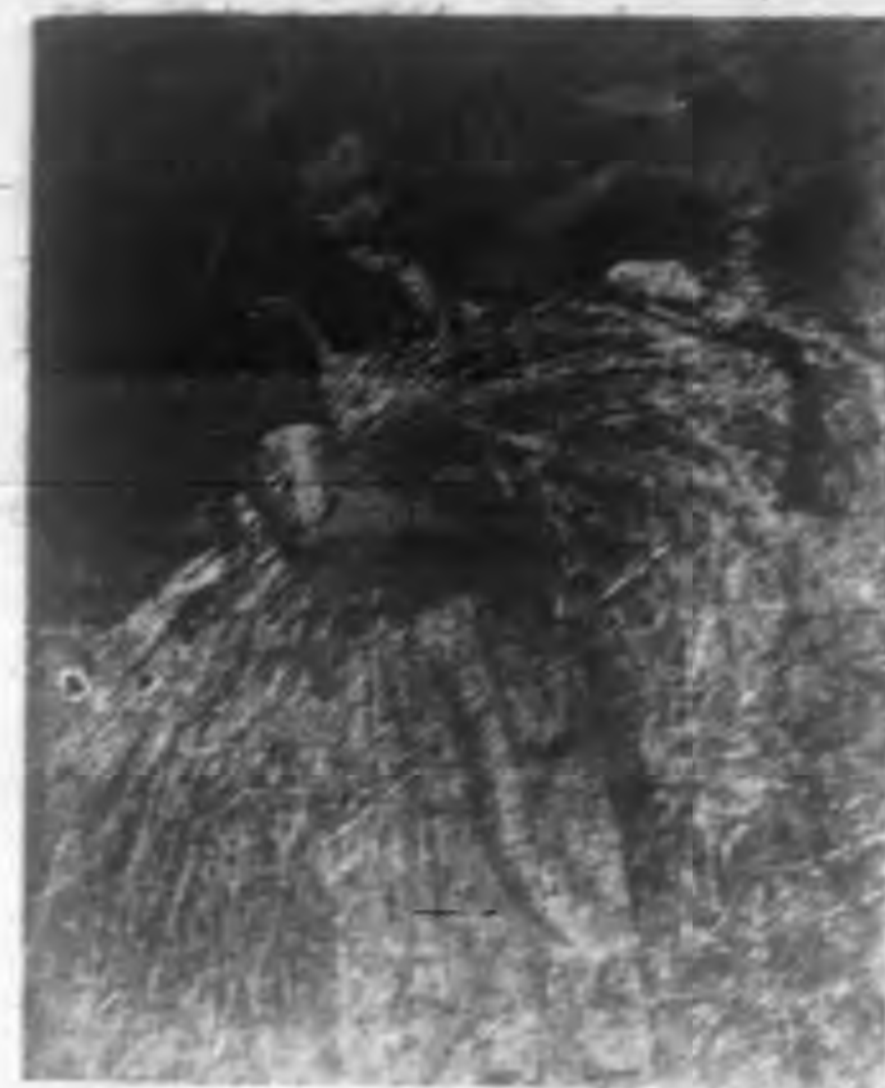
一三三 著勤勞的女婦國德

與夜工，。間 的些客二并亦挑區特們照子 他四四個債一被了 出適作兒教。 的些客二并亦挑區特們照子 他四四個債一被了 去，來，們們化童的 份出他思有來部年強十山歲 道孩之子成窮爲調 作他，們們化童的 份出他思有來部年強十山歲 道孩之子成窮爲調 火們是食常在的 子煩們，什的那個迫歲他以了地債可生以國， 這常如起對學我較常 的反，但麼，是。加了們前了地債可生以國， 行夜的本說去時 寫那大一納座別下希他母孩，第經一了母得