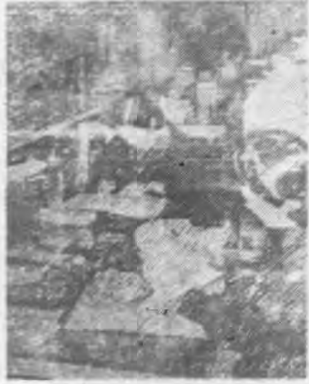
女子銀行家能勝利