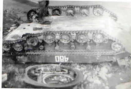
Боевая машина пехоты, подорванная на фугасе

Подготовила Дарья САБАЕВА.