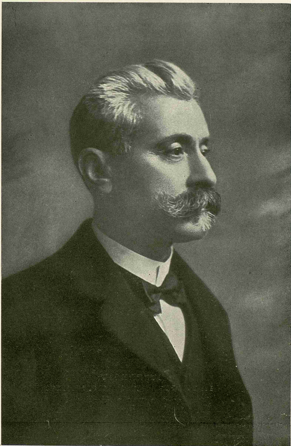
SPIRU C. HARET