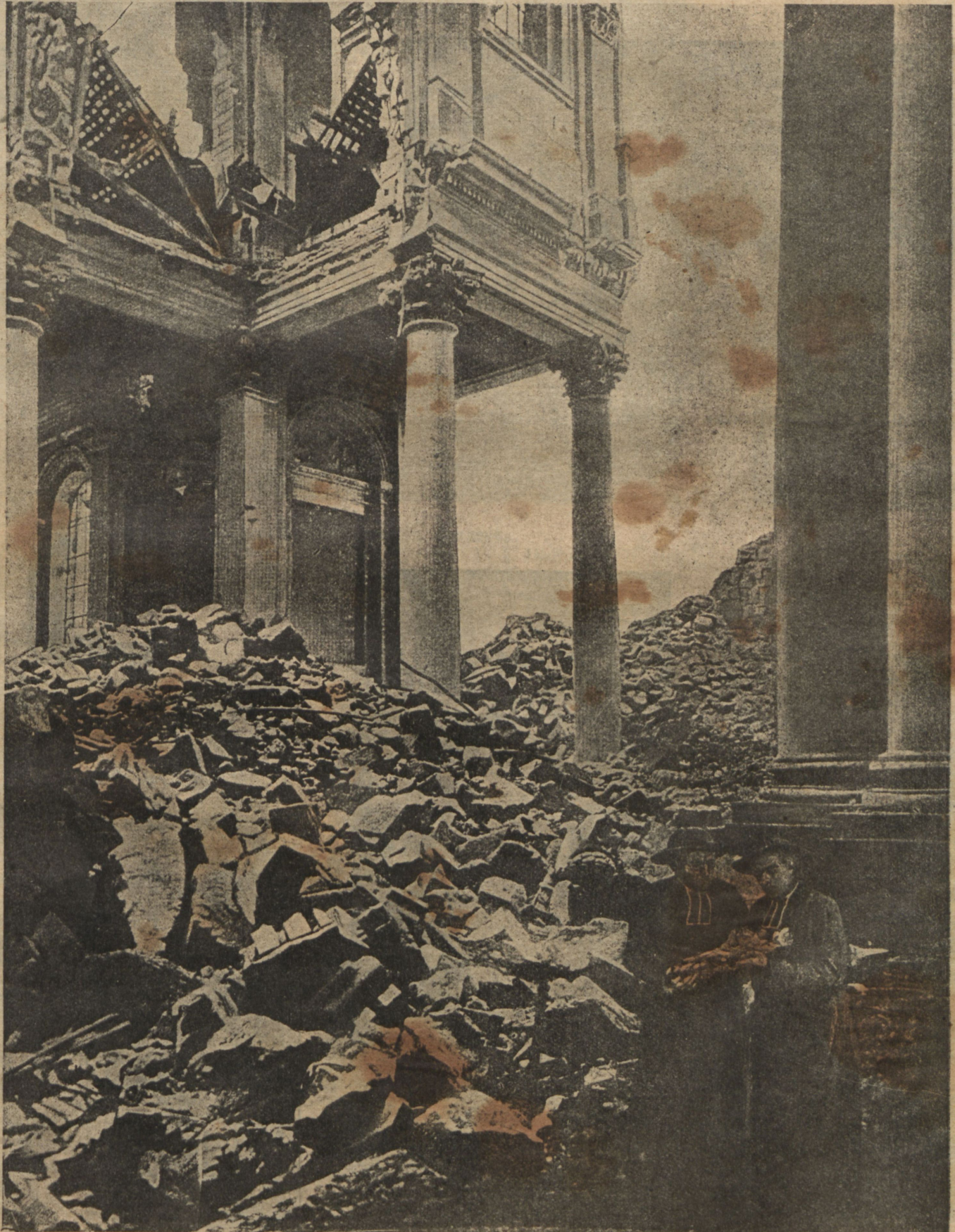
Развалины кафедрального собора въ Аррасѣ.