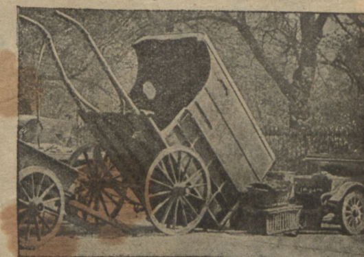
Одна изъ баррикадъ на улицахъ Дублина.