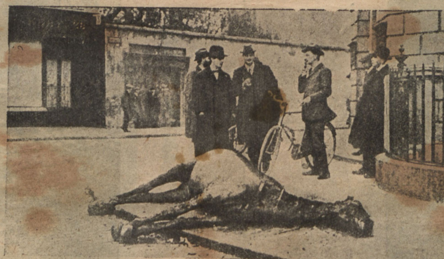
Лошадь, убитая при перестрѣлкѣ повстанцевъ съ английскими войсками.