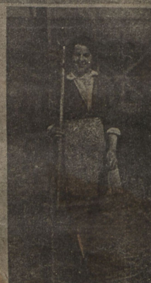
Въ сельскомъ хозяйствѣ.