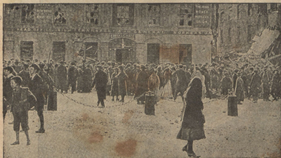
Разрушенный английскими солдатами залъ Свободы.