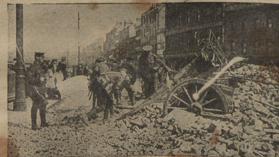
Развалины дома, сожженного повстанцами.