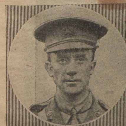
Вожь повстанцевъ Пери, казненный по приговору англійскаго суда.