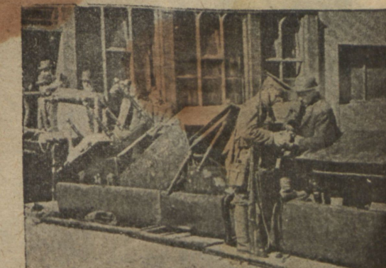
Баррикады, устроенныя повстанцами.