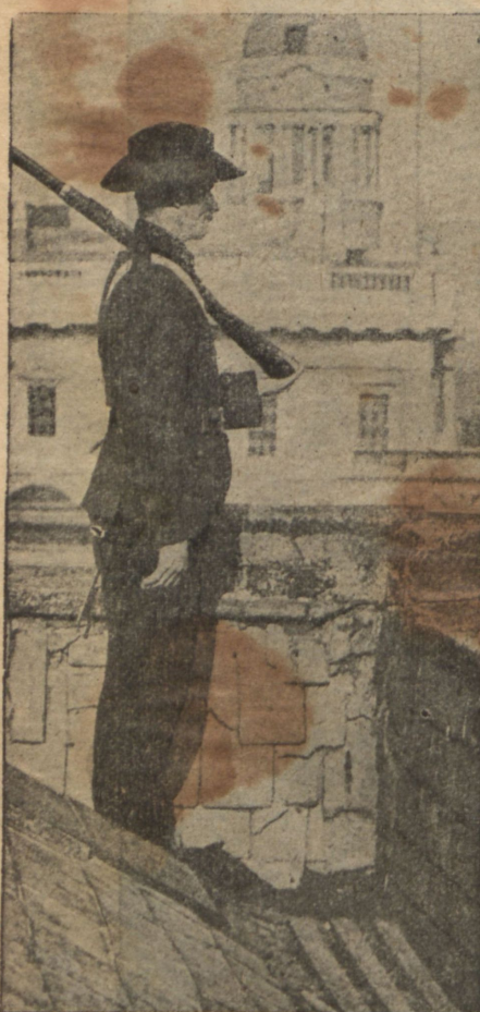
Часовой повстанцевъ на посту.