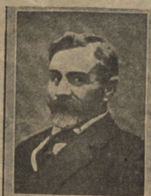
Серъ Кезментъ, одинъ изъ главарей возстанія.