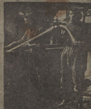
Въ машинномъ отдѣленіи.