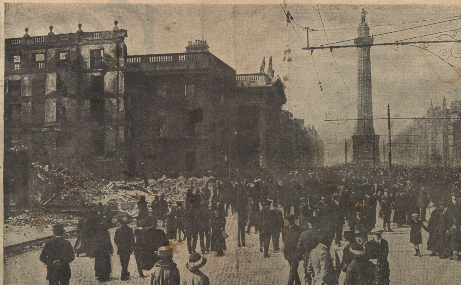
Развалины „Метрополь Отеля“ и главнаго почтамта, которые были разрушены обстрѣломъ английскихъ войскъ.