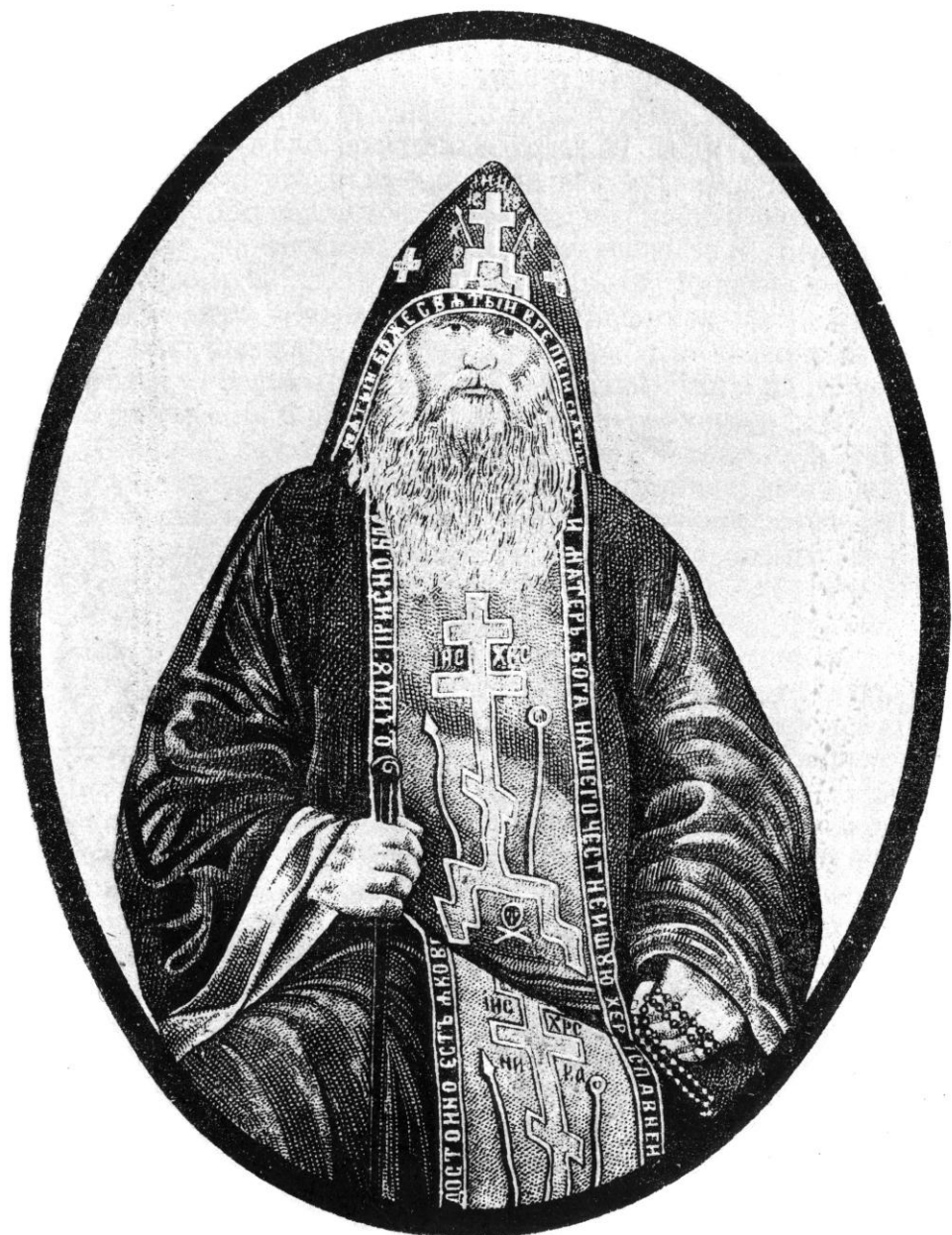
Іеромонахъ Галактіонъ. Въ Схимѣ Игнатій. скончался Июля 14 д. 1900 г.