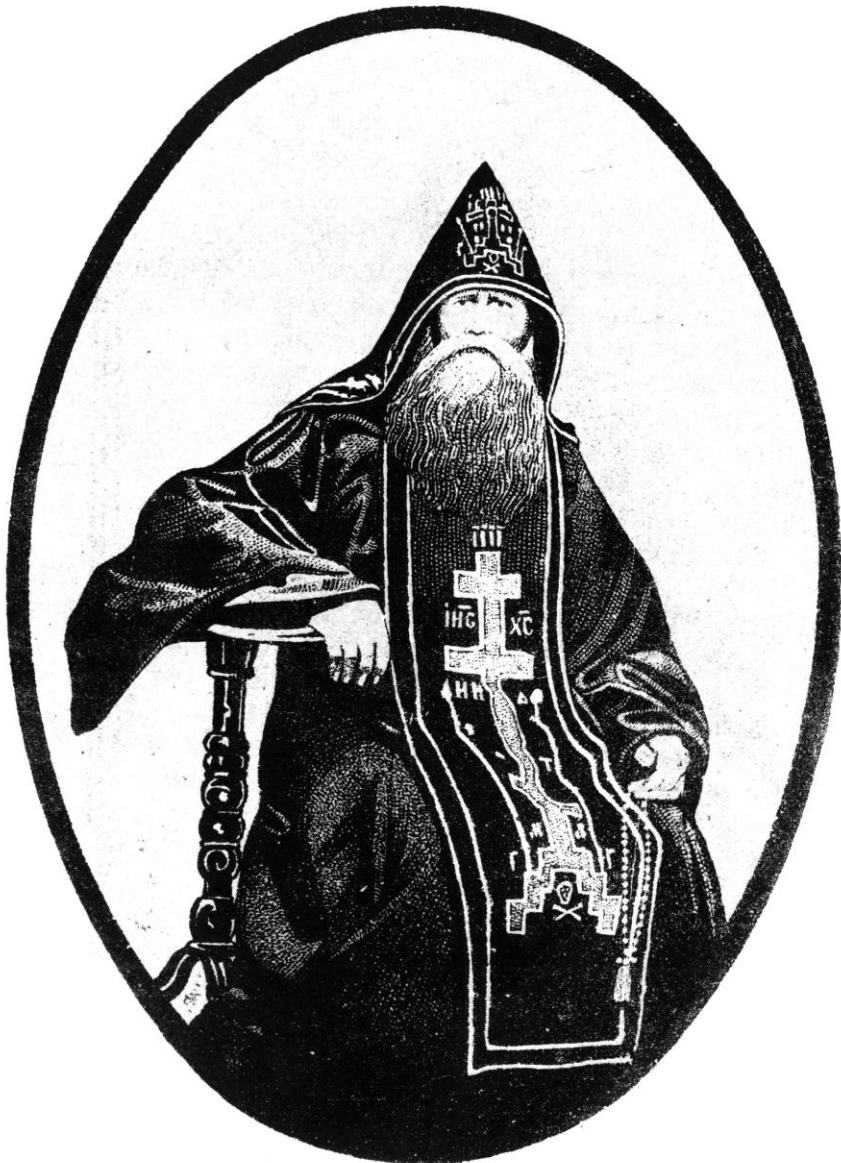
Схимонахъ Филиппъ: Основатель переръ и Боголюбивой Киновіи, сконч. 14/5 18д1860г.