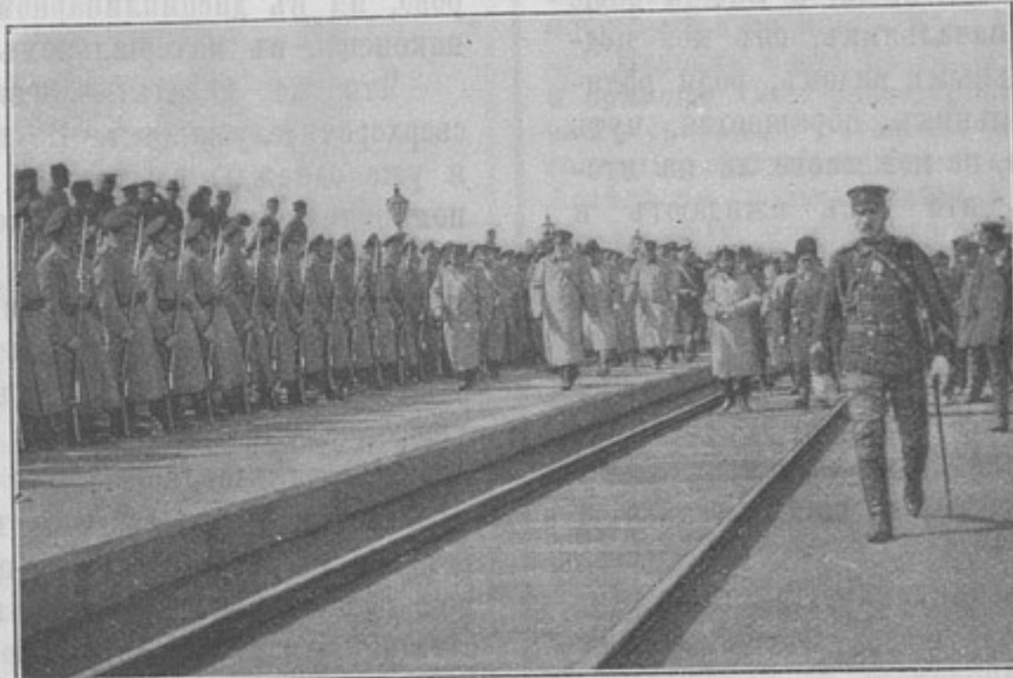
Генер. Куропаткинъ и Линевицъ въ Ляоянѣ.

Вездѣ капитаны и ротмистры командуютъ ротами и эскадронами. Нигдѣ ни въ одномъ родѣ войскъ нельзя встрѣтить того, чтобы офицеръ въ этомъ чинѣ служилъ субалтернъ-офицеромъ. Мы разумѣемъ здѣсь, конечно, исключительно службу въ строю. Не то, къ сожалѣнію, мы видимъ въ Донскихъ казачьихъ полкахъ. Тутъ сплошь и рядомъ приходится наблюдать такое ненормальное явление: есаулъ, прокомандовавшій 6—8 лѣтъ сотнею ѣздить въ строю передъ взводомъ въ качествѣ субалтернъ-офицера. Когда-то, кажется до 1892 года, и у насъ нельзя было встрѣтить ничего подобнаго. Въ полку всегда находилось налицо шесть есауловъ и всѣ они, конечно, командовали сотнями. Субалтернствовать имъ тогда не приходилось. И это было въ порядкѣ вещей. До чина вѣд есаула нужно было прослужить не менѣе 16—18 лѣтъ. Этого времени оказывалось слишкомъ достаточно для того, чтобы изучить обязанности младшаго офицера. Но вотъ въ названномъ году былъ измѣненъ штатъ офицеровъ въ первоочередныхъ донскихъ казачьихъ полкахъ; вмѣсто прежнихъ шести есауловъ, положено ихъ имѣть двѣнадцать. Отсюда и