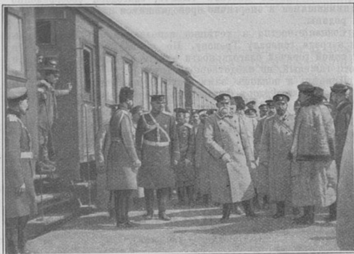
Генер. Куропаткинъ и Линевицъ въ Ляоянѣ.

пошло то ненормальное явление, о которомъ мы упомянули выше. Раньше, какъ только есаулъ приходилъ со льготы въ полкъ, онъ тотчасъ же и сотню принималъ. Теперь же не то; теперь онъ сначала долженъ прослужить почти три года субалтернъ-офицеромъ. И хороше еще если это есаулъ молодой, который не командовалъ еще сотнею. Для него не такъ обидно ѣздить передъ взводомъ въ строю, передъ которымъ, кстати сказать, онъ проѣзжалъ уже около 20 лѣтъ. Но представьте себѣ въ этой роли есаула, который нѣсколько лѣтъ прокомандовалъ сотнею, получалъ не разъ благодарности отъ высшаго начальства за отличную подготовку ея во всѣхъ отношеніяхъ, чело-вѣка часто заслуженнаго и убѣ-леннаго уже сѣдинами! Вѣдь положеніе въ самомъ дѣлѣ незавидное. Но это еще не все. Нерѣдко такому есаулу приходится переживать положеніе еще худшее. Пробывъ 1—2 года