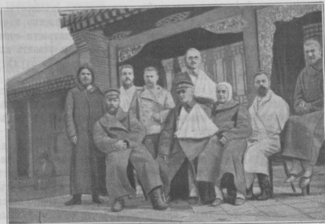
Группа раненыхъ офицеровъ съ священ. Щербаковскимъ въ лазаретѣ Ея Величества въ Мукденѣ.