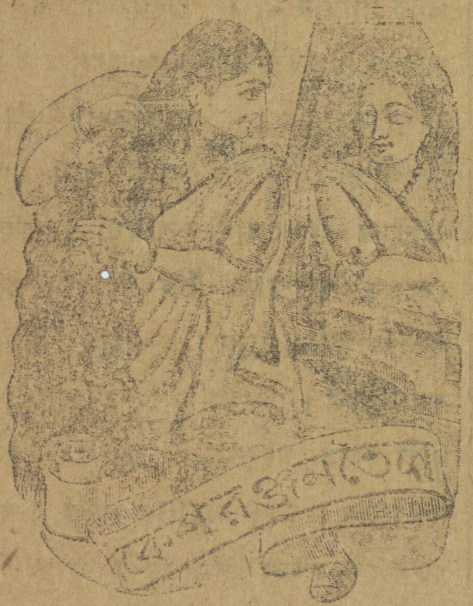
কপন সাক্ষাৎ হইতে বয়সীরা সৌন্দর্য প্রতীয়মান হয়। সৌন্দর্য বৃদ্ধি কার্যে কেশরঞ্জন ব্যয়িতারা।

৩৭শ সংখ্যা | বুধবার ২৩শে ফাল্গুন বৃষাব্দ ১৩২৯ ইংরাজী 7th March 1923