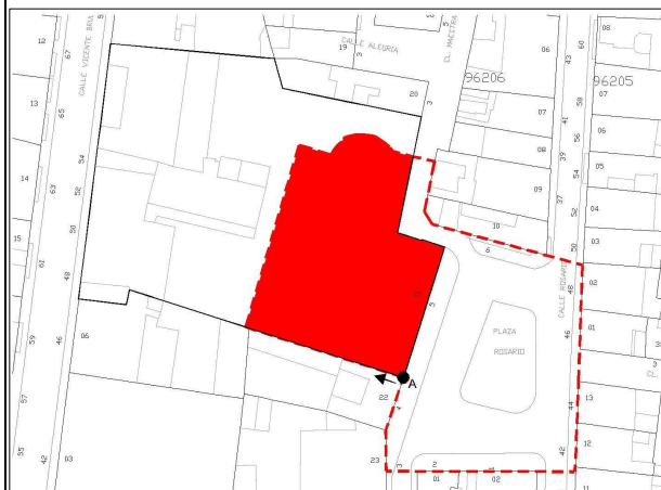
Entorno de protección. Identificación de los elementos protegidos