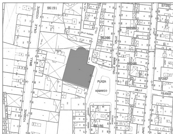
Cartográfico C.G.C.C.T 1980