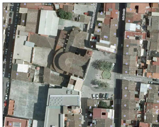
Fotografía Aérea 2008

Cartografía Catastral: YJ2791H Manzana: 96191 Parcela: 21 CART. CATASTRAL: 423-10-II IMPLANTACIÓN: ESQUINA FORMA: IRREGULAR SUPERFICIE: 948,06 m 2