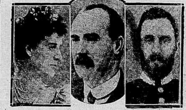
A condessa de Markiewicz, condemnada a trabalhos forçados; James Connolly, preso e fuzilado summaria mente, e Roger Casement, condemnado a morte.

longados do auditorio, e lagrimas de uma boa parte delle.