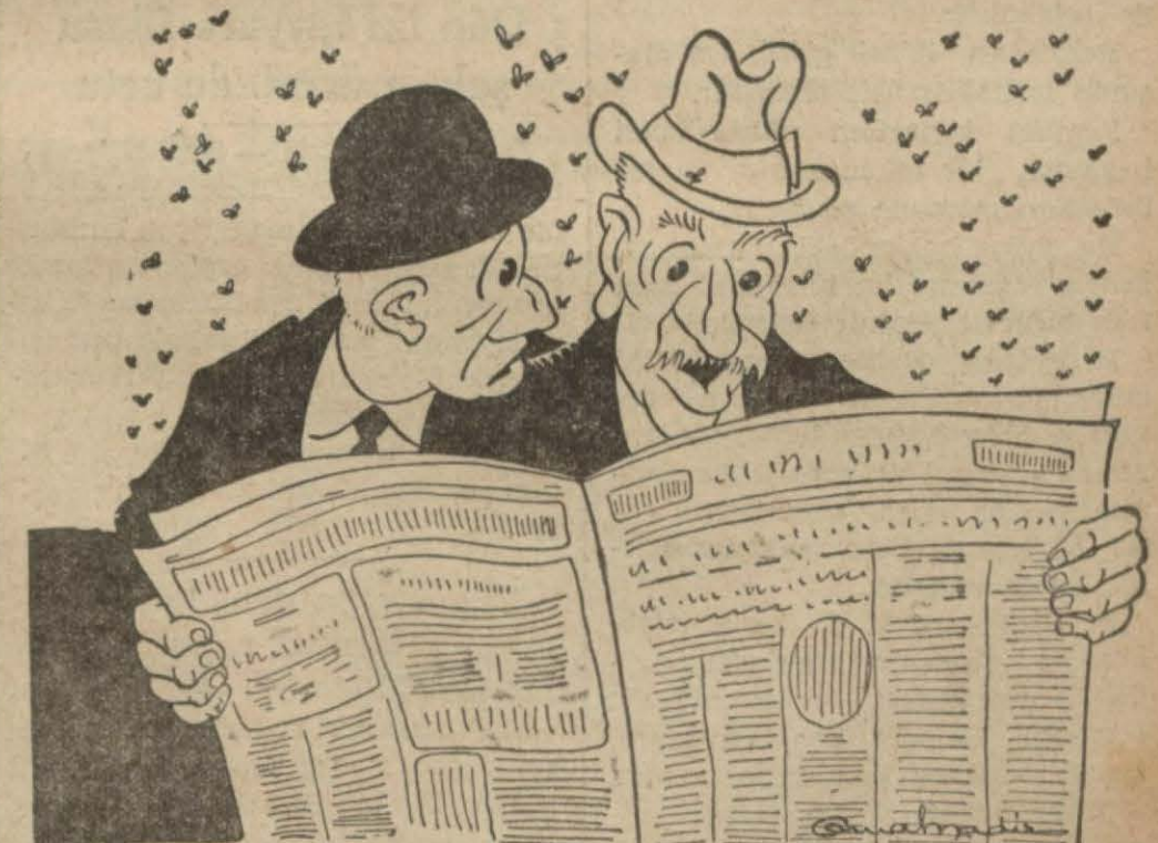
Fatihli — Vay canına, Madrde yaklaşmışlar!..