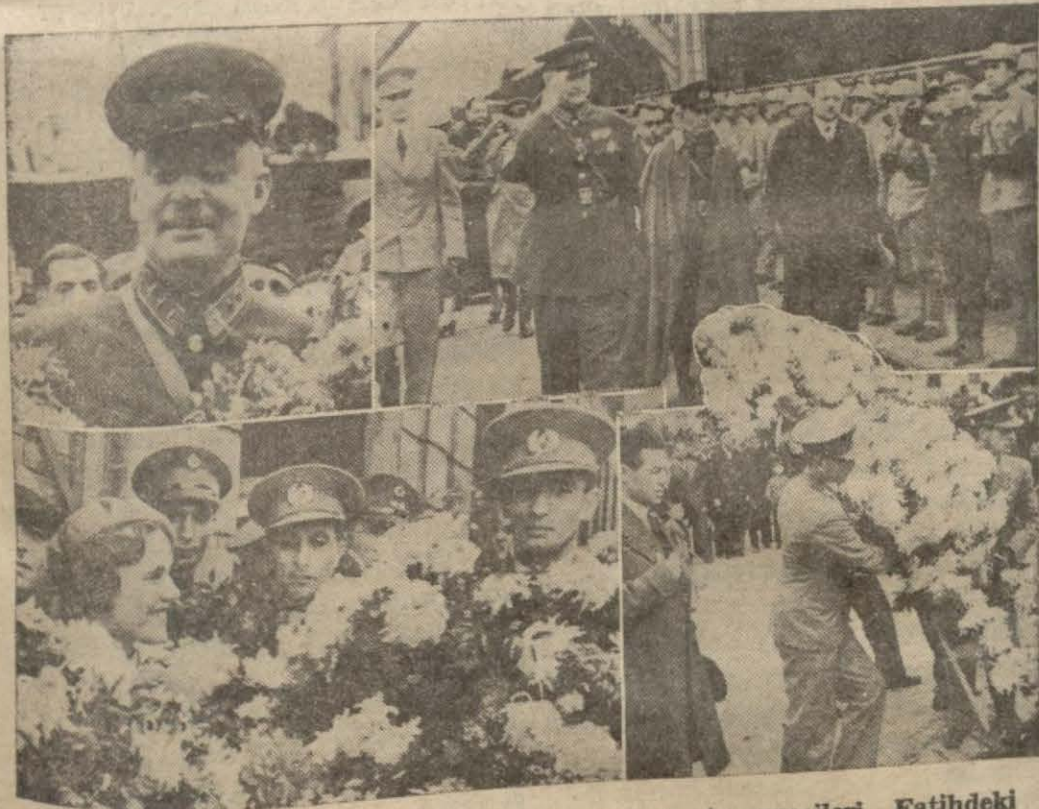
General Aydeman rıhtında, misafirimiz Sovyet tayyarecileri Fatihdeki Tayyare âbidesine çelenk koyarken

Size memleketimin ve milletimin muhabbetlerini getirmek için Türkiyeye gelyoruz