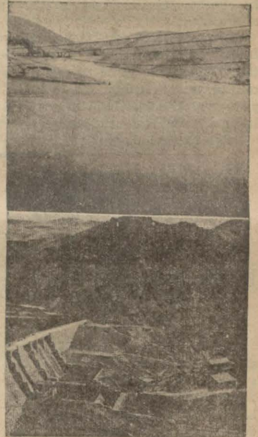
Yukarıda: Suni gölden, aşağıda baraj tesisatından iki görünüş

Cumhuriyetin ilânile beraber Ankara devlet merkezi olunca nüfus derhal bir misli artarak yetmiş beş bine çıkmış ve bu sefer su meselesi daha büyük bir zaruret halinde kendi-