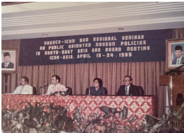
1985 - Perhelatan "UNESCO-ICOM Sub Regional Seminar on Public Oriented Museum Policies in South-East Asia and Board Meeting ICOM-ASIA " yang diselenggarakan oleh Departemen Pendidikan dan Kebudayaan, Direktorat Jenderal Kebudayaan pada tanggal 15-24 April 1985 di Jakarta.