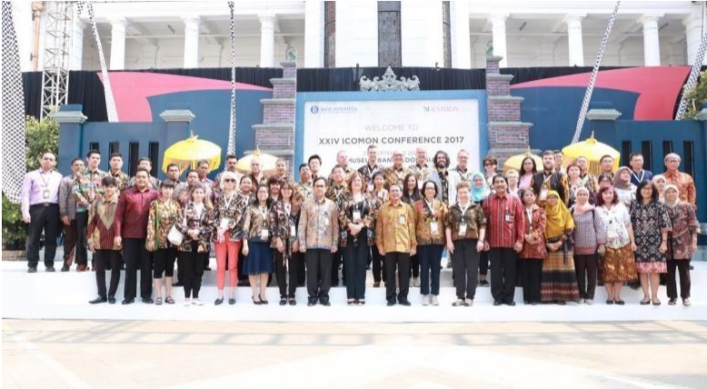
217 - Perhelatan XXIV ICOM komite ICOMON Conference 2017 yang diselenggarakan oleh Bank Indonesia dengan ICOMON di Museum Bank Indonesia, Jakarta Indonesia. (Sumber: Koleksi Museum Bank Indonesia 2017).