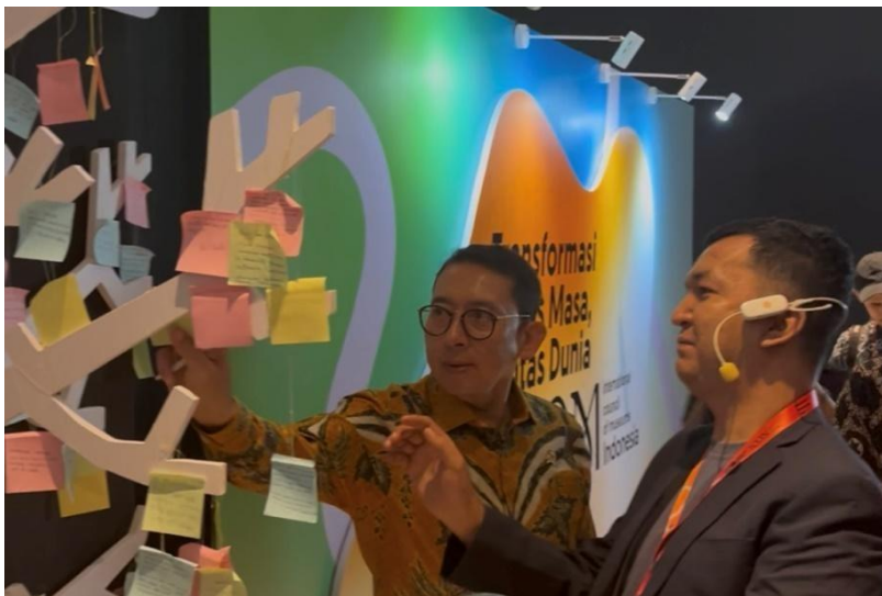
2025 - Menteri Kebudayaan (Fadli Zon) menuliskan harapannya terhadap permuseuman Indonesia pada kegiatan pameran "Transformasi Lintas Masa, Lintas Dunia: ICOM Indonesia".