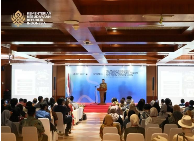
2025 - Menteri Kebudayaan (Fadli Zon) memberikan sambutan pada acara pembukaan pameran "Transformasi Lintas Masa, Lintas Dunia: ICOM Indonesia" dan "SEA Museum Collaboration: Innovating Museum Public Programs for a Rapidly Changing Society" pada 22 Mei 2025 di Museum Nasional Indonesia.