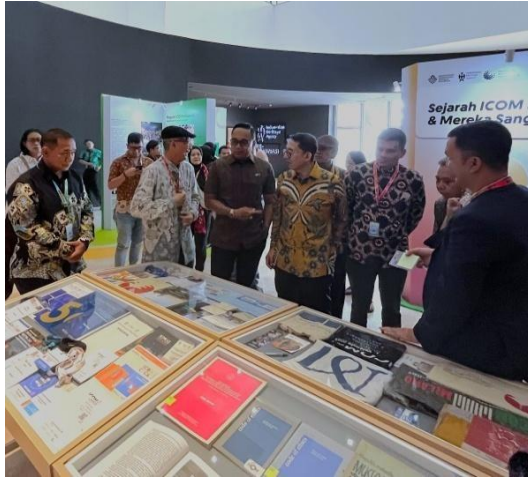
2025 – Menteri Kebudayaan (Fadli Zon) melihat koleksi memorabilia kegiatan ICOM dari berbagai negara pada pameran “Transformasi Lintas Masa, Lintas Dunia: ICOM Indonesia” pada 22 Mei 2025 di Museum Nasional Indonesia. (Sumber : Koleksi Dina S, 2025).