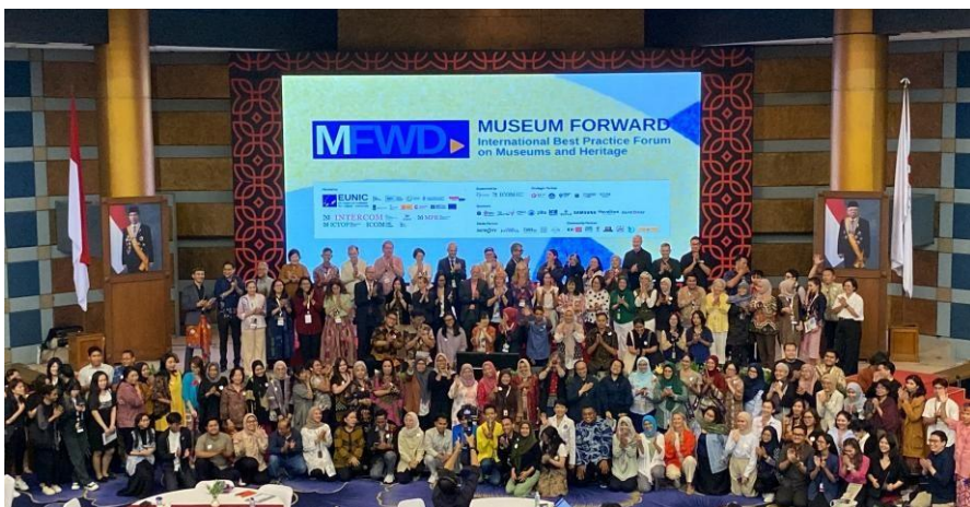
2024 - Perhelatan Museum Forward "International Best Practice Forum on Museums and Heritage" oleh EUNIC ( European Union National Institutes for Culture ) Indonesia bersama ICOM INTERCOM, ICOMON, MPR, ICTOP, ICOM Hrvatska yang Berlangsung pada tanggal 24-25 September 2024 di Jakarta.