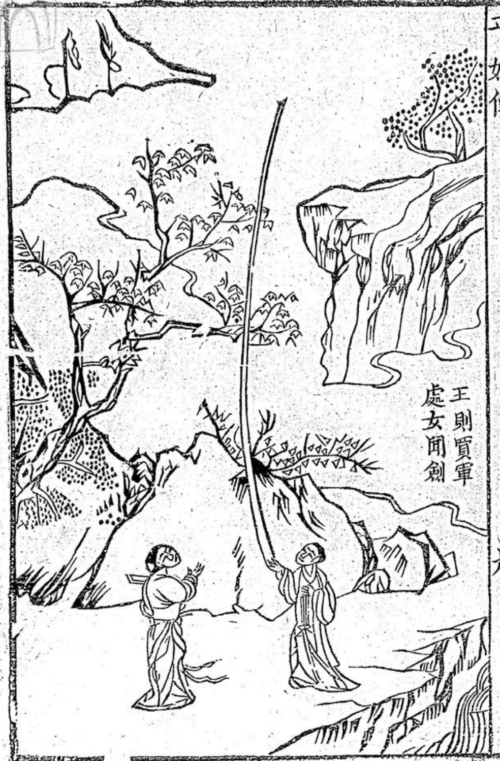
王則質軍 處女聞劍