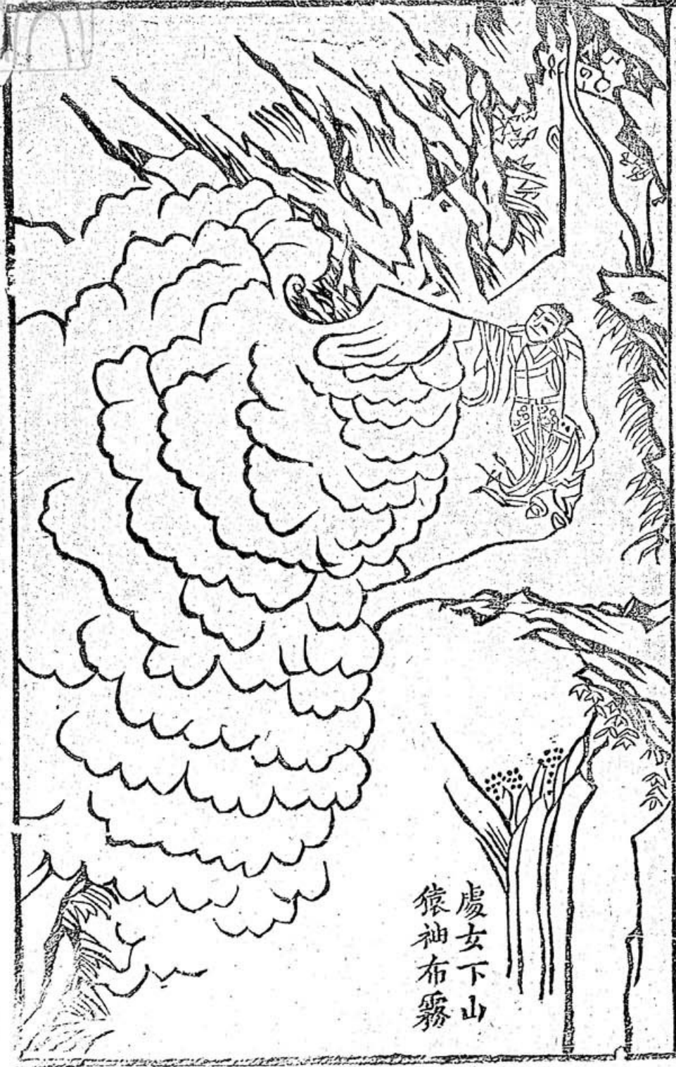
虔女下山 猿袖布霧