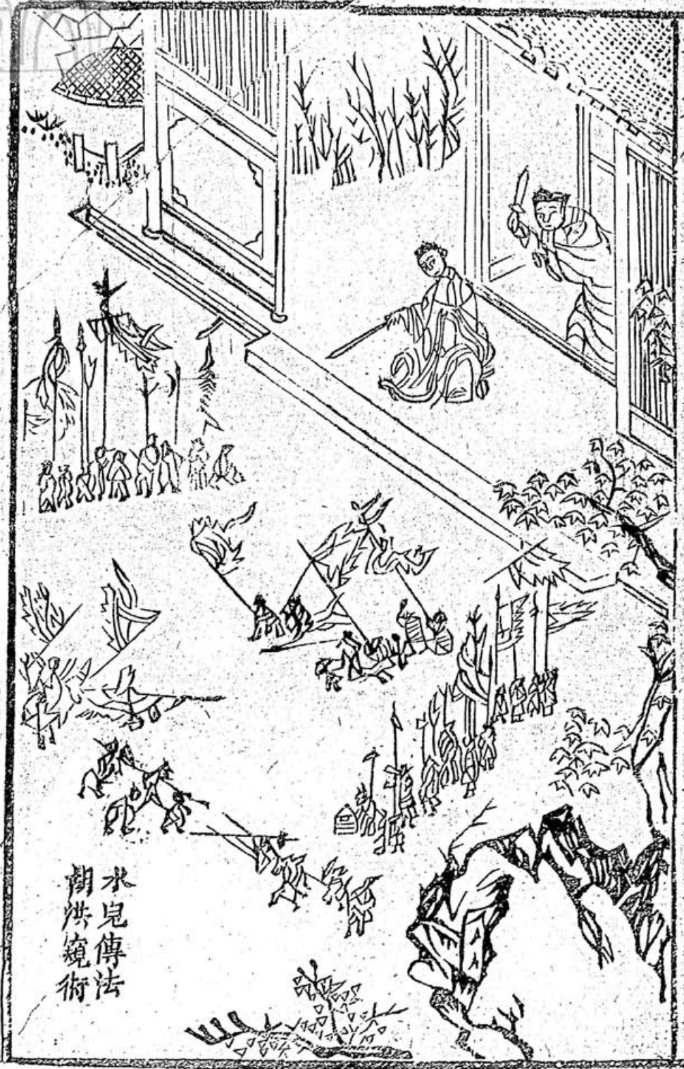
水兒傳法 湖洪鏡術