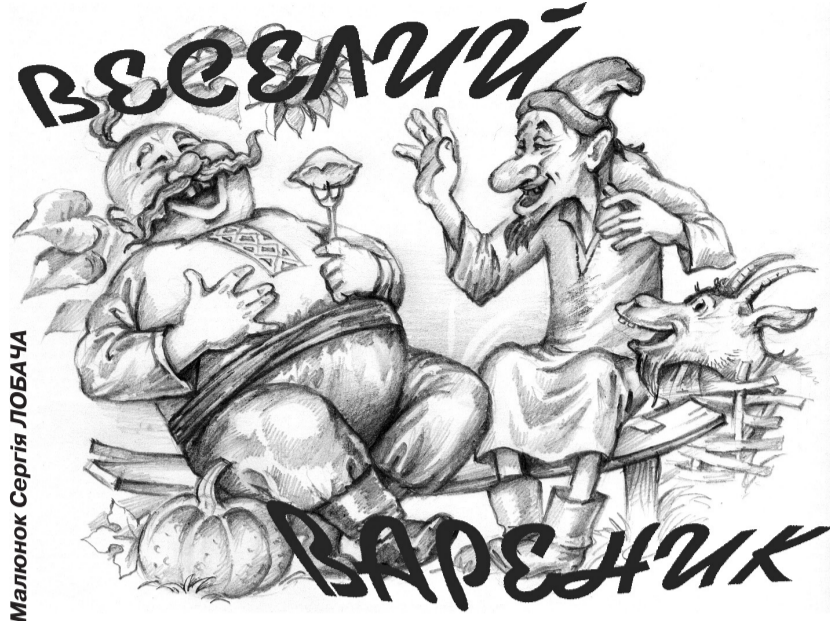
Малюнок Сергія ЛОБАЧА