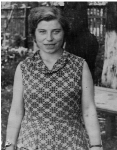
Уперше не відчувала голоду, навпаки — поправилася, погарнішала... 1963 рік