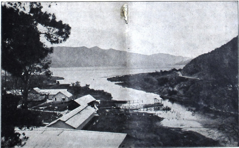
မြန်မာ့ အစာအာဟာရ အကျိုးစီးပွား အကျဉ်းစာအုပ် Takengon - : မြန်မာ့ အစာအာဟာရ အကျိုးစီးပွား အကျဉ်းစာအုပ် : -