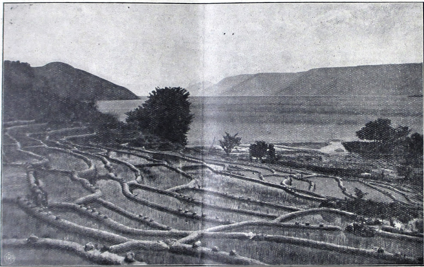
විභවය පිළිබඳව විග්‍රහණය කිරීමට

විභවය පිළිබඳව විග්‍රහණය කිරීමට විභවය සිතා කටයුතු කරනු ලබන්නේ විභවය අඩු වීමට හේතු වන්නේ නිසි පරිදි නොවන බැවිනි.