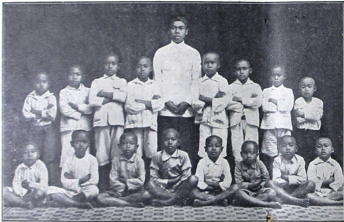
|| ආයතනික වාදන මණ්ඩලය || ඉන්දියානු Ind. Arts මණ්ඩලය ||