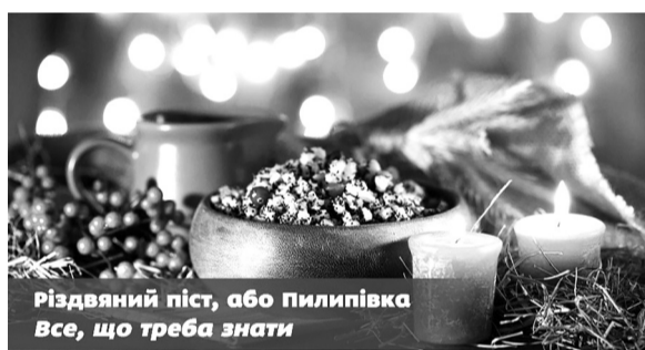
Різдвяний піст, або пилипівка Все, що треба знати