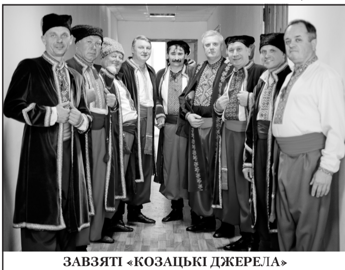
ЗАВЯТІ «КОЗАЦЬКІ ДЖЕРЕЛА»

Всім низький уклін і всіляких газрадів зичимо, творчого натхнення, миру, злагоди й здоров'я на довгі роки!