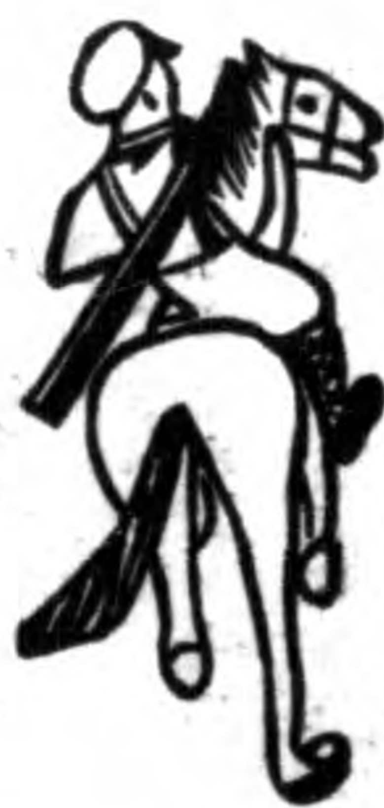
小 歌 謠