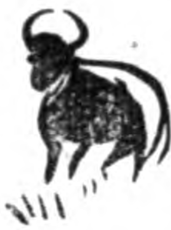
小 文 藝

我畢業後的志願，只要家庭環境能夠維持，絕對是繼續讀書的。使我的學問宏富；身體健全；人格尚高後。再到社會上作事，利用我所學的技能，創造偉大的事業，獻給國家；獻給人民。打倒侵略我國的英美強盜；剷除擾亂社會的淪共份子。把中國造成一個光明正大的國家。這就是我的志願，但不知能達到否？不過古語說得好：「世上無難事，只怕不用心」。若我的志向堅定，還怕不會達到嗎？！