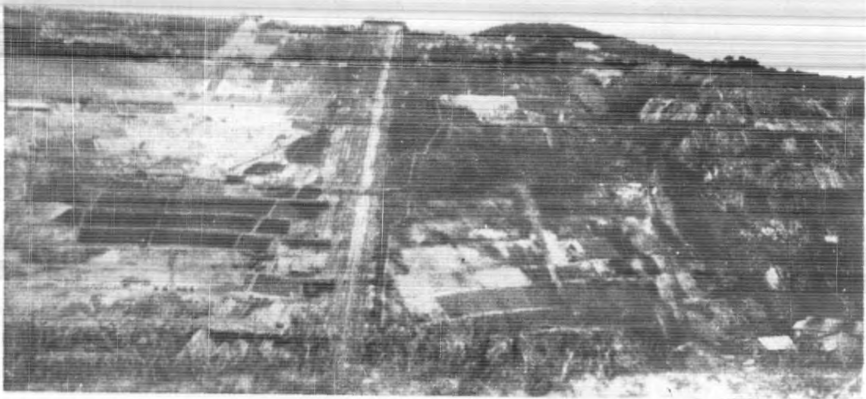
(一)坑鑛鑛錫之坡隆吉(丙)