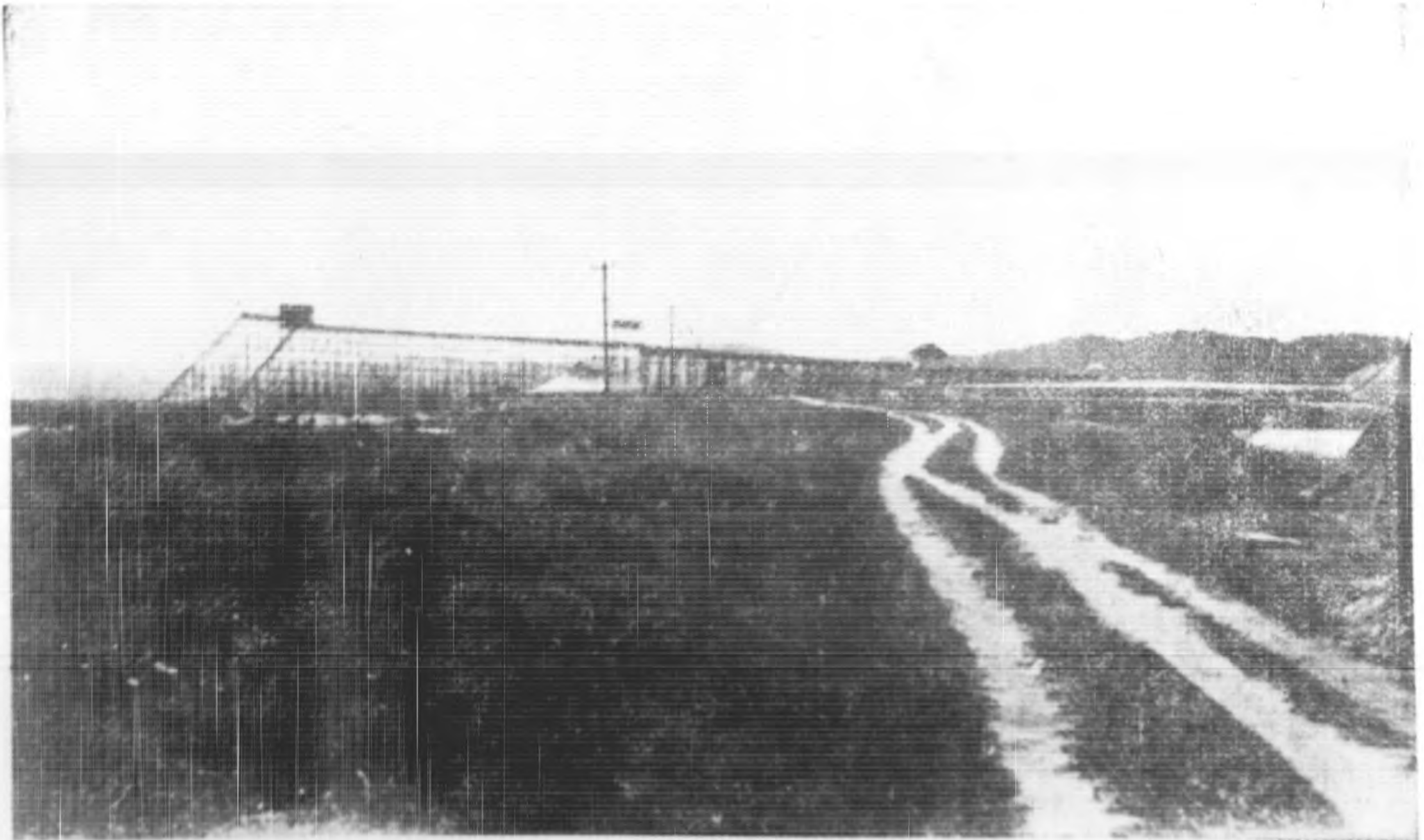
槽水錫淘之鑛錫探開機水吸用靈霹 (乙)