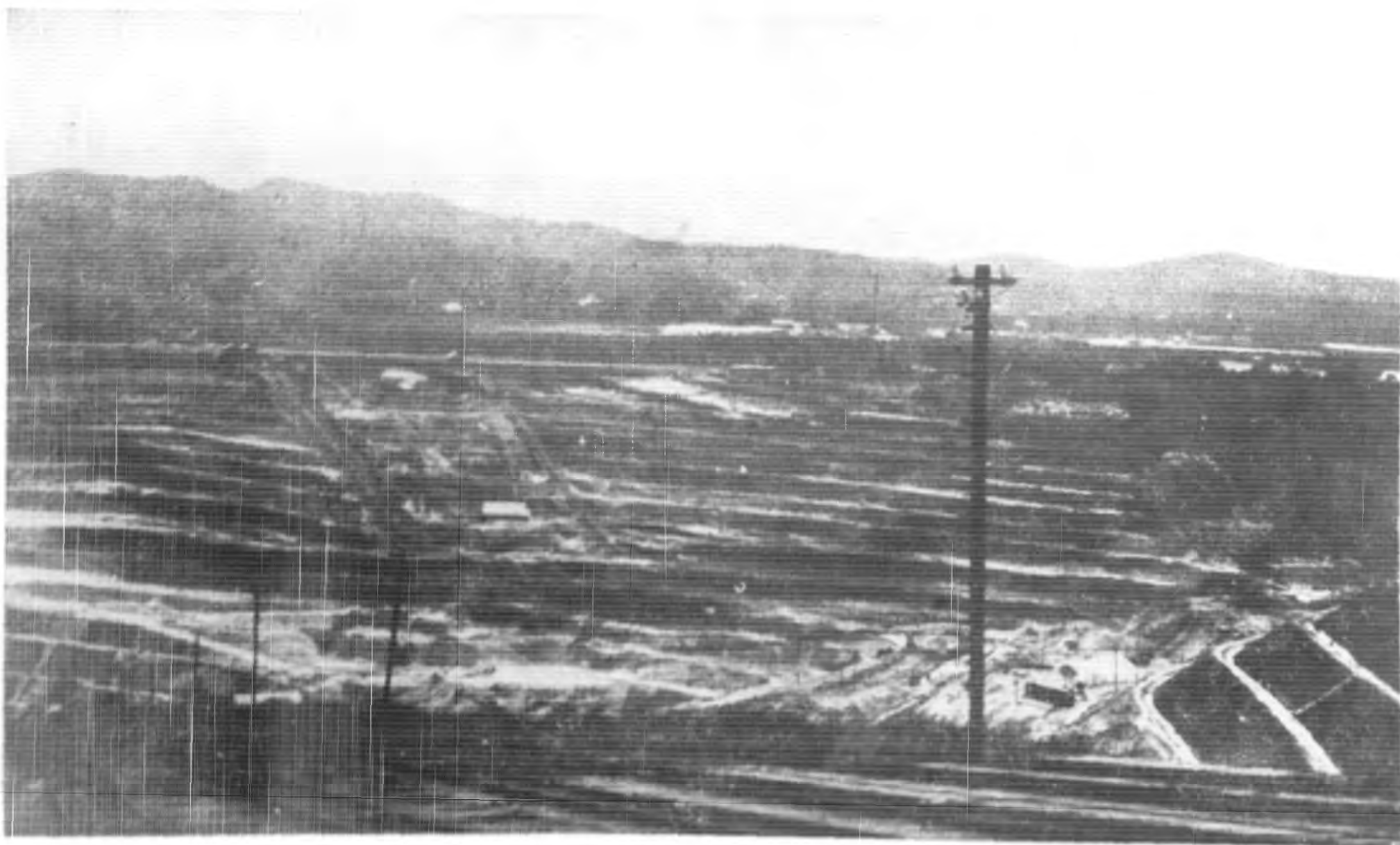
(二)坑鑛鑛錫之坡隆吉(丁)