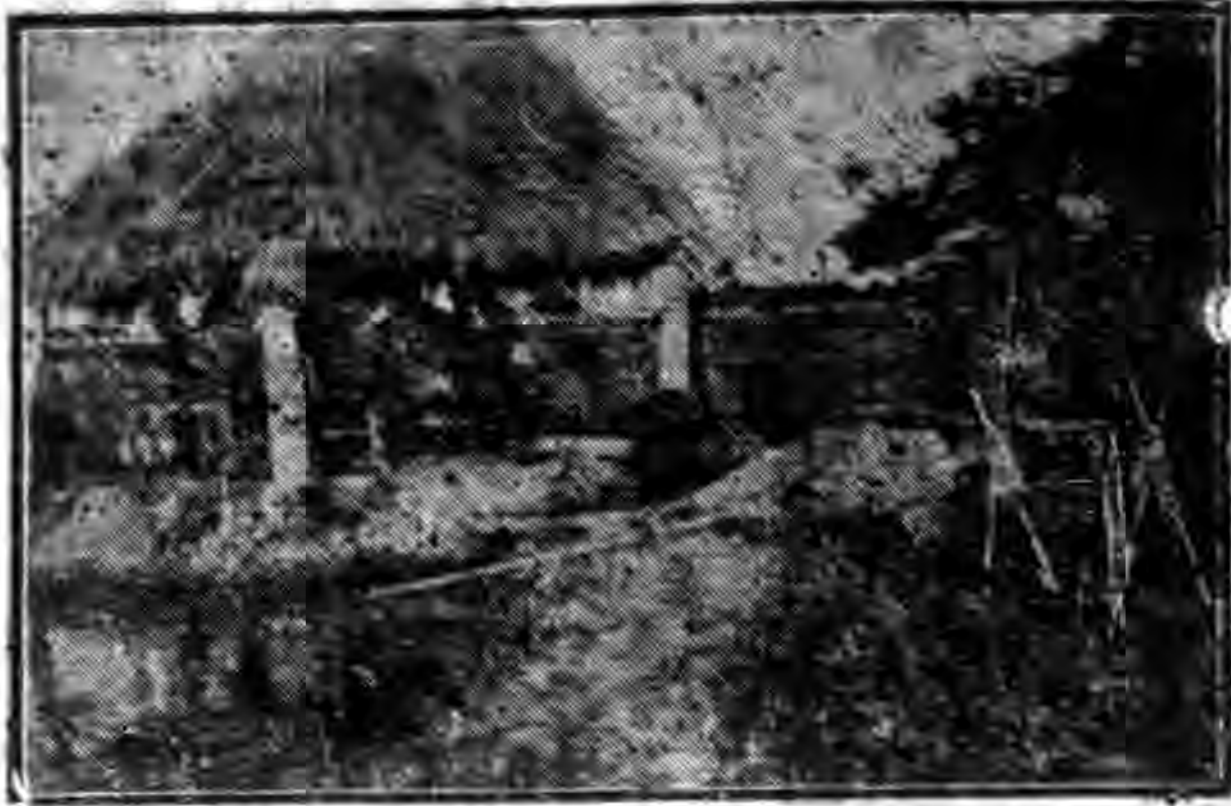
牛車打水

圖是過了竹離，屋是已經有了破舊的樣子，屋上的瓦是零亂疊着，破碎的牆已經向左傾了，這好像農村破產的象徵嗎？屋裏面是死沉沉的一些沒有