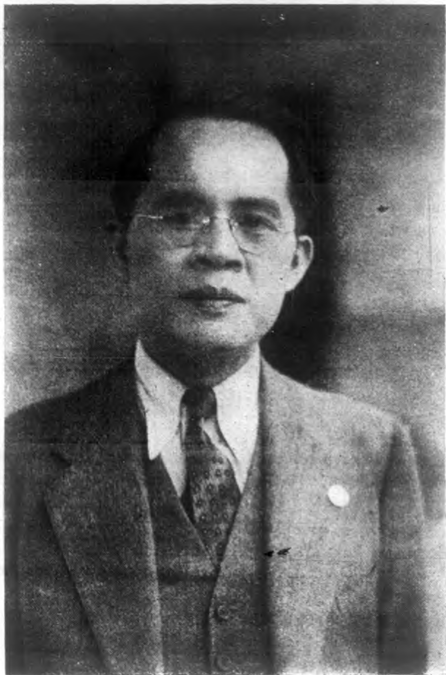
生先生柏林長事理理代會本