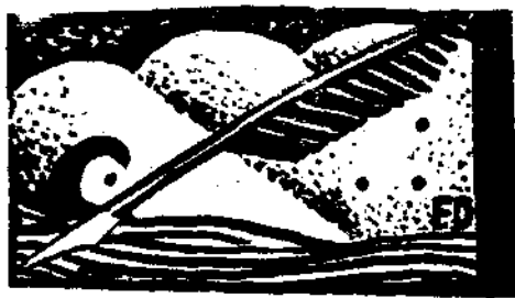
筆 白 丁 伐

每到了國事緊張的時候，就到了西南元老們說話的時候：南昌會議，本是預備應付外交緊張的局面，然而西南元老們却拿自己編造的消息，打出「寒電」來攻擊。對社會宣稱：是「對中央讓策」，我們不知道他們有沒有讓策讓策自己？於是弄得中央要人去電解釋，未辦外交，先辦「內交」，這就是西南兩個暗形機關在外交戰緊張中所給與中央的讓策。嗚呼！何何言哉！