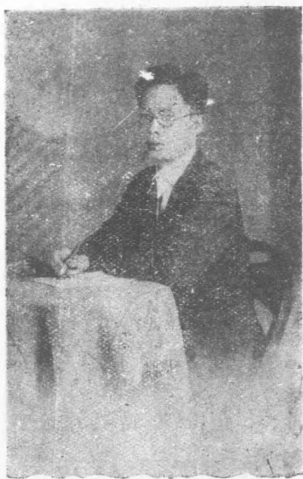
影 近 者 著