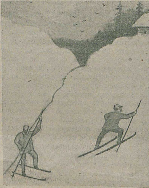
Рис. № 3.

то въ одну, то въ другую сторону (рис. № 1). Лыжники, не изучившіе основательно поворотовъ, не должны избирать этотъ способъ подъема на гору. Третій способъ подъема на кругую гору, это такъ назыв. «елочкой» (рис. 2).