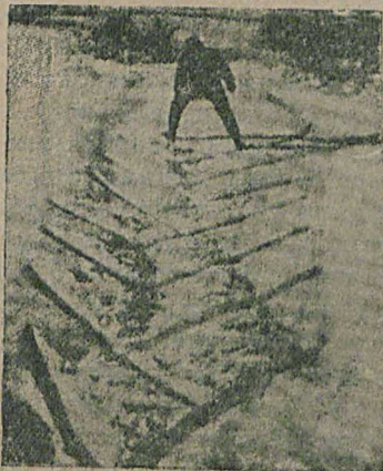
Рис. № 2.

При болѣе крутыхъ горахъ прямой подъемъ уже невыполнимъ. Въ такихъ случаяхъ примѣняется такъ называемый зигзагообразный подъемъ. Лыжникъ идетъ наискось горы и попеременно дѣлаетъ описанные въ предыдущемъ № повороты