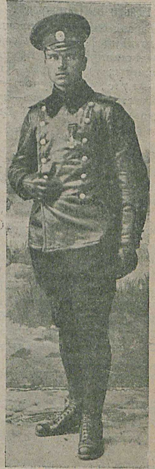
Николай Кирилловичъ К., установившій всероссійскій рекордъ высоты съ пассажиромъ. (Разрѣш. военной цензурой).

2-й разрядъ, 500 метр.: 1) Бубликовъ—50,2 с., 2) Басовъ—51,6 с., 3) Румянцевъ—51,8 с.