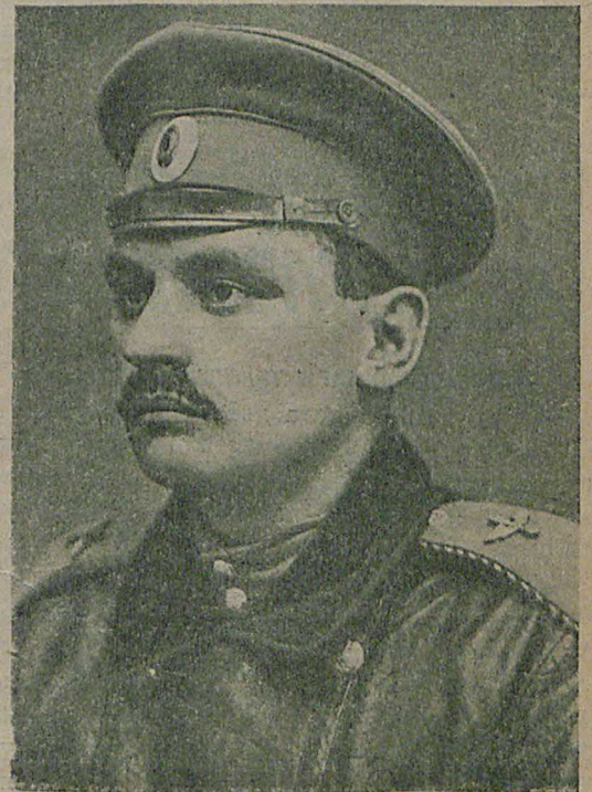
Ученикъ школы авіаціи Б., поднявшійся въ качествѣ пассажира во время рекорднаго полета авіатора К.

Призы выданы: 1-й—Трофимову, 2-й—Фарисееву, 3-й—Дронову.