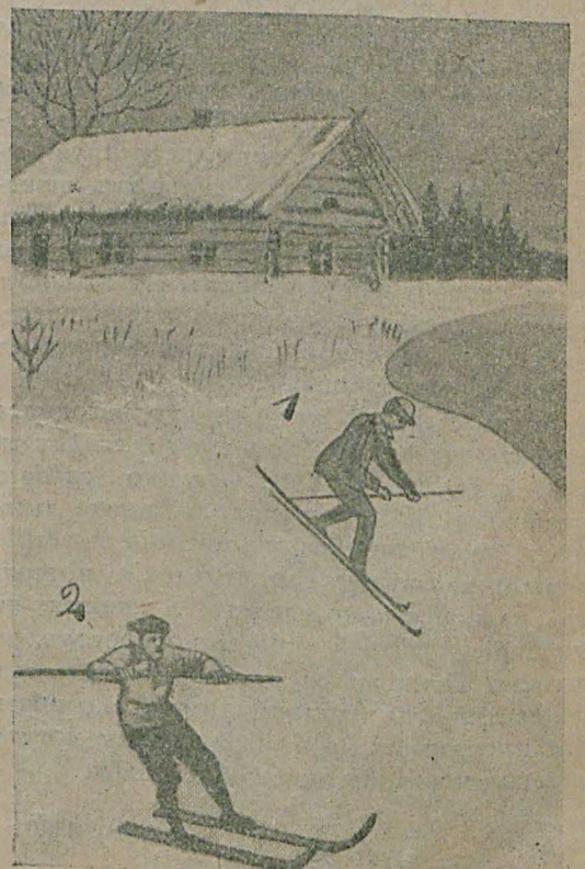
Рис. № 4.