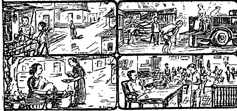
சிறிய கடைகள் பெரிய கடைகள் ஆயின.