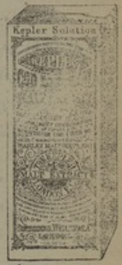
شكله مصغر جداً

محلول ، كبلار ، يشفي من امراض الملاريا والطاعون وكل مرض يمتري الانسان خصوصاً من لا يستطيع ان يتناول غذاه العادي . وبعد المداومة على تعاطيه يحول الجسم من المرض الى القوة والسمن وترجع القوة كما كانت