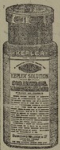
شكله مصغر جداً

محلول ، كبلار ، هو اعظم طعام مقو يساعد السن وله مفعول كبير في تركيب الجسم محلول ، كبلار ، يحول بسرعة غريبة الى دم وعضلات ومادة لحمية ودهنية وعظمية وعجبه محلول ، كبلار ، يشفي من امراض السل اذا اخذ في حينه واذا تناوله الشبان المصابون بامراض الظهر والساق ثلاث مرات كل يوم قوى بدنهم واستطالة قامتهم