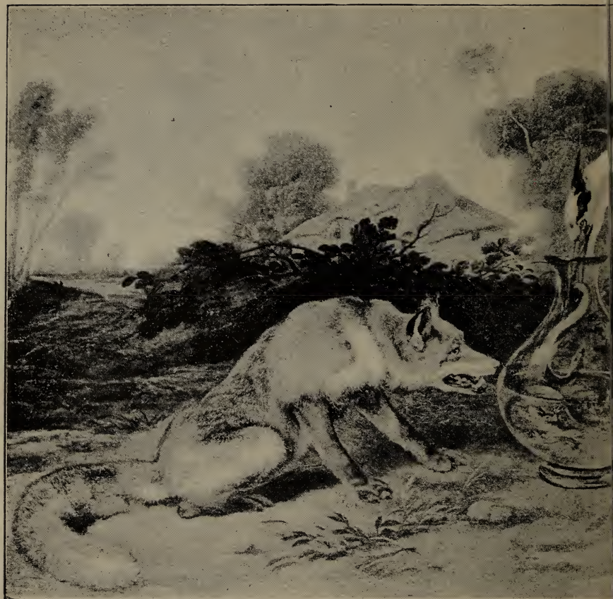
N:o RÄFVEN PÅ KALAS HOS HÄ Tillhör hr (Fins