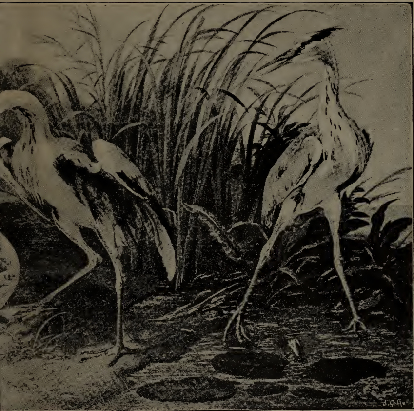
92. ERN. AF FRANS SNIJDERS. ARL EKMAN (ing).