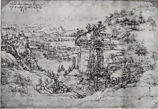
LEONARDO, LANDSCHAFTSSTUDIE. UFFIZIEN