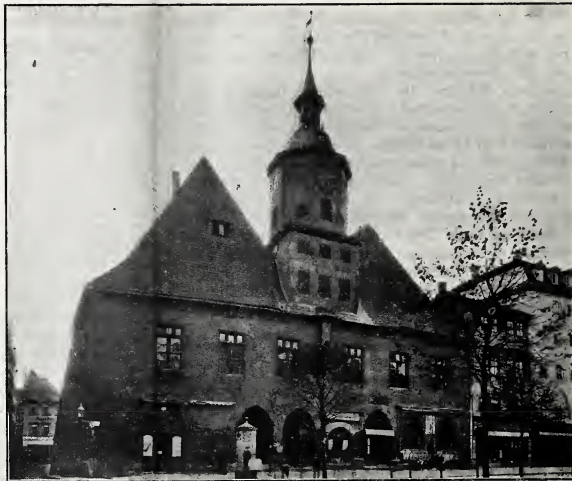
Rathaus zu Jena

Zu dem Abschnitt: Saalbauten mit Verwaltungsräumen auf einfacher Grundform.