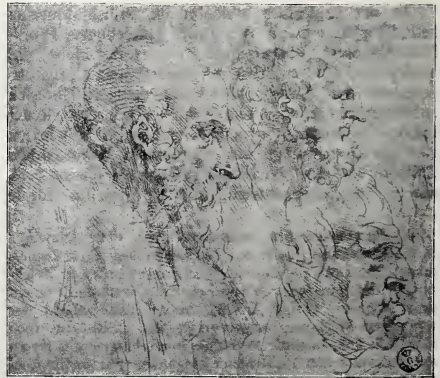
LEONARDO, KOPF EINES GREISES (ANGEKLEBTES BRUCHSTÜCK UNTEN RECHTS). UFFIZIEN

3) Die angebliche Beziehung einer ganz leichten Kopfskizze auf einem anderen Blatte in den Uffizien zu dem hl. Leonardo scheint mir sehr unsicher.