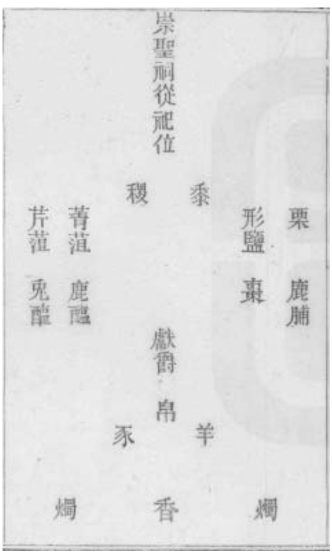
東廡二案 西廡一案