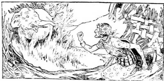
老 婦 人 怒 沖 沖 地 責 問 大 象

恨恨地亂飛，亂飛，飛到大象先生的耳朵裏而來。大象先生怒極了，突然向山邊一撞，一棵大樹竟被震倒了，滾啊，滾啊，大樹直滾到山下去，撞破了一個老婦人的一間茅屋。