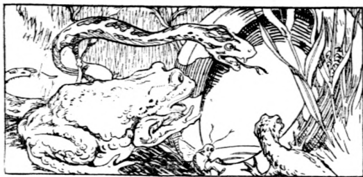
他們望下去，水壺是空的。

他們氣昂昂地喝問小蝦，小蝦只得回答要選冷水。於是他們就把小蝦扔到一個池裏去了。不過這小蝦實在不怕水的，他潛到水底，却在休息呢。