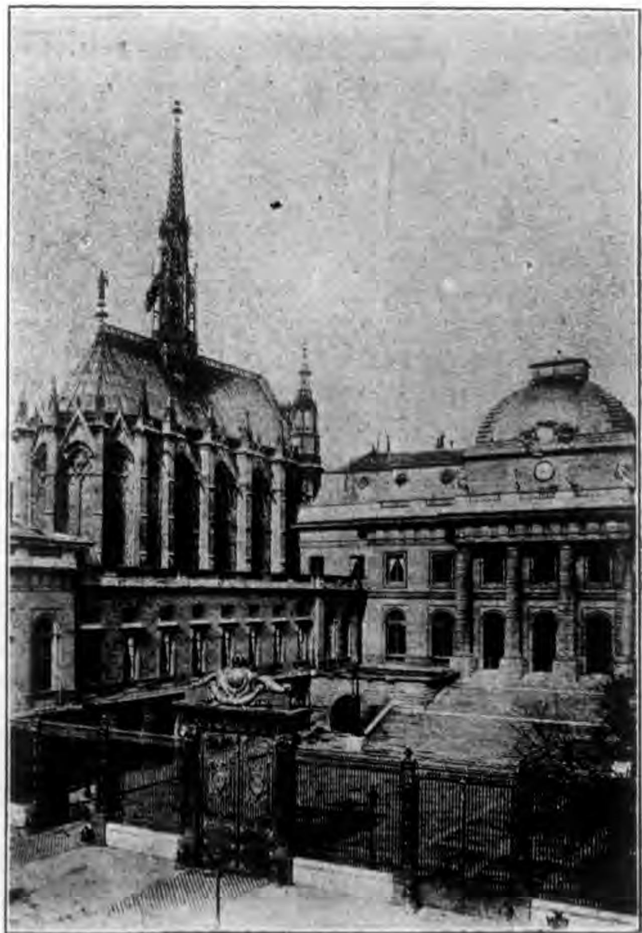
殿聖之建所京法在冠茨蘇耶藏珍爲思類聖王法