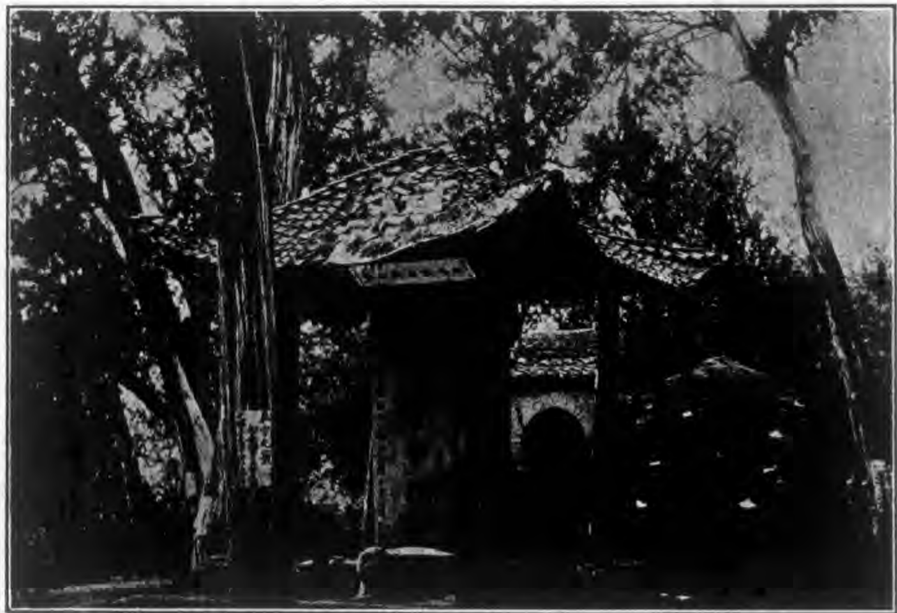
陵橋名陵一有亦山橋在山橋葬崩帝記史