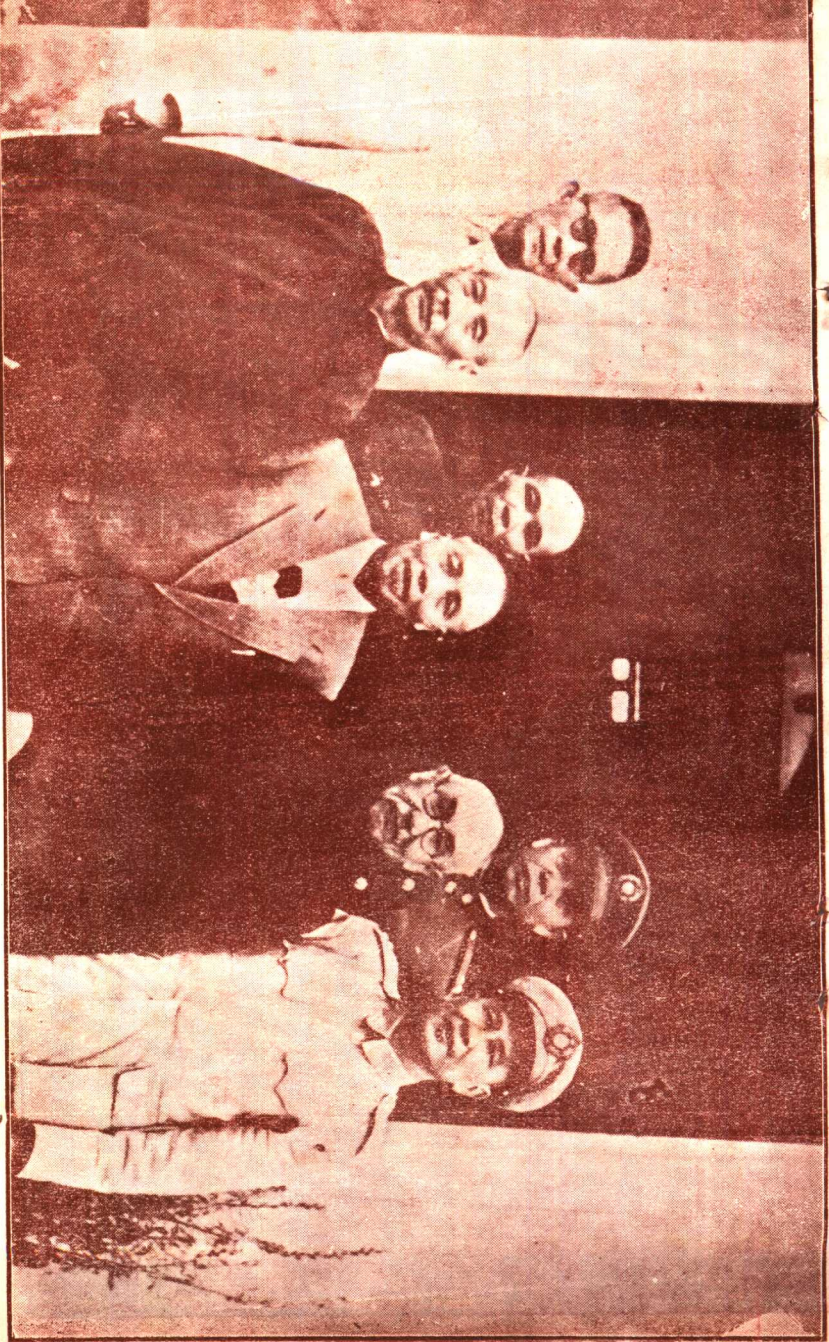
文亭生覺居初旭黃統總代李川伯岡齡鶴亭生健白左向右由影合等統總代李與林桂赴次首