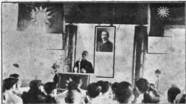
在廣州民眾團體歡迎會致詞