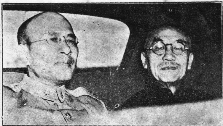
與白長官健生汽車上