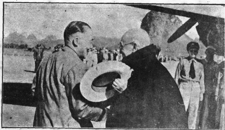
赴桂林李代總統在機場歡迎