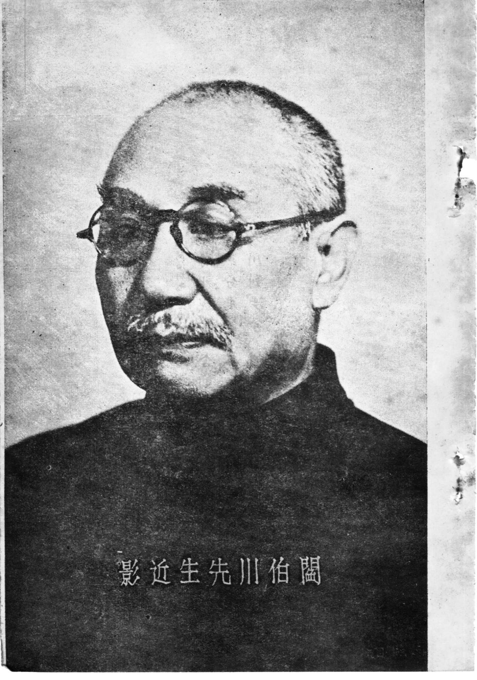
影 近 生 先 川 伯 闔