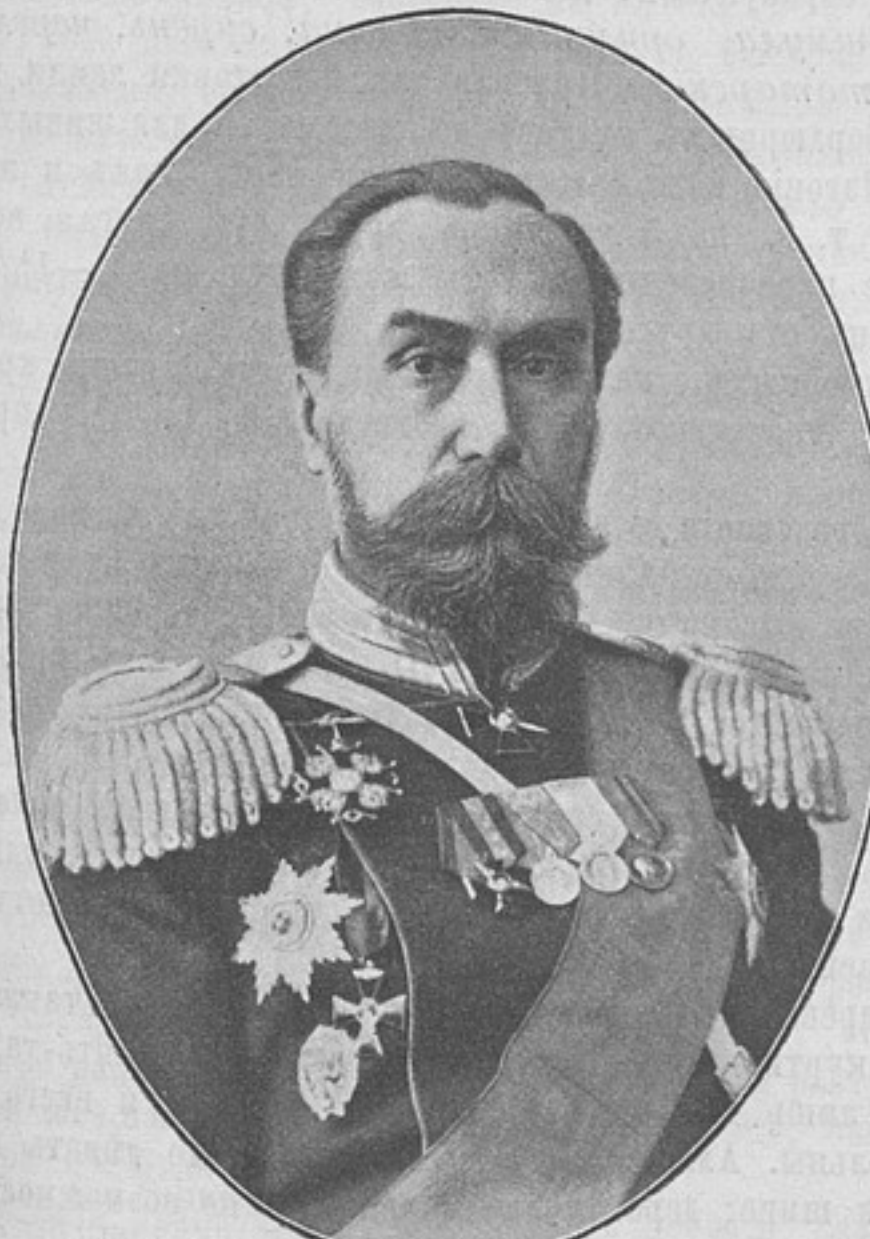
Начальникъ Военно-Юридической академіи, генераль-маіоръ Флорентій Николаевичъ ПЛАТОНОВЪ.

ПУСТОЙ ПРИЮТЬ ген.-отъ-инф. Г. Г. Бѣлоградскаго для круглыхъ сиротъ офицерскаго званія (смотри «Развѣдчикъ» № 317, стр. 1000), ЕСТЬ СВОБОДНЫЯ ВАКАНСІИ.