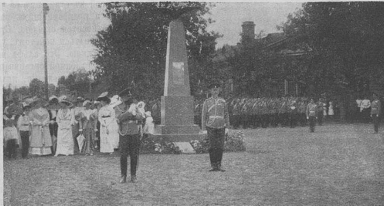
Памятникъ „Славы“ 4-го уланскаго Харьковскаго полка, открытый въ день столѣтія сраженія у Нацбаха. (Къ корресп. „Бѣлостокъ“).

только «высшими» и полиціей, обязанными слѣдить за исполненіемъ Высочайшихъ распоряженій. Стремленіе штатскихъ походить одеждою на военныхъ коснулось и черныхъ накидокъ,—къ нимъ они пристегнули металлическія застѣжки! Накидки военныхъ должны быть, немедленно, отличены,—къ нимъ можно дать обшивку, по бортамъ и по башлыку, хотя бы яркою цвѣтною тесьмою, различною для генераловъ, для штабъ и для оберъ-офицеровъ, а со статскихъ долой металлическія застѣжки, долой все напоминающее военное платье, и начать надо снятіемъ генеральскихъ подкладокъ съ «рябчиковъ», какъ ихъ называлъ вѣчной, свѣтлой памяти, незабвенный герой, Суворову—равный,—Скобелевъ. Надо съ дѣломъ этимъ не медлить, надо спѣшить поднять уваженіе и