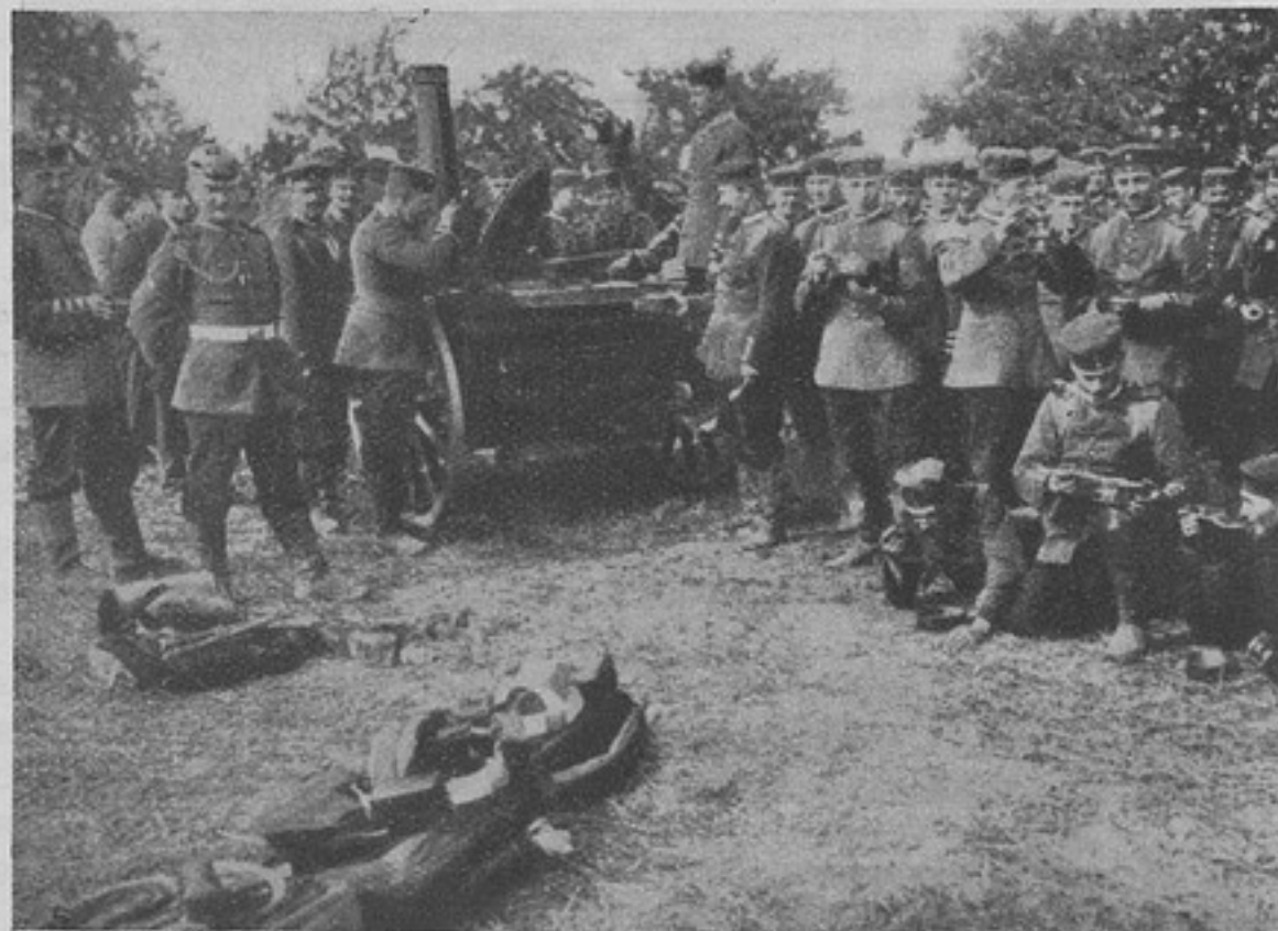
Походная кухня на германскихъ маневрахъ.

Святою и неуклонною обязанностью «высшихъ» должна быть забота о слугахъ Престола и Родины не только пока слуги эти, полные силъ и здоровья, стоятъ подъ знаменами, но и тогда, когда слуги эти, честно исполнивъ свой долгъ, покинули службу. Умудренные знаніями и опытомъ жизни «власть имущіе» не могутъ не знать, что военное дѣло только тогда выиграетъ и армія сохранитъ свои лучшія силы, когда служащіе будутъ видѣть, что память о нихъ и заботы правительства, по мѣрѣ возможности, не прекращаются и по оставленіи ими службы; тогда служить будутъ «не за страхъ, но и за совѣсть», служить будутъ ревностно, а не только для отбытія номера. Разъ находящіеся на службѣ будутъ имѣть на глазахъ примѣръ въ родѣ раздѣленія отставныхъ на вышедшихъ въ отставку послѣ 1-го января 1909 г. и до, или преимуществъ, даваемыхъ бывшимъ въ японской войнѣ передъ бывшими въ другихъ войнахъ, будутъ видѣть такую, бьющую въ глаза, несправедливость къ одинаковымъ, одинаково служившимъ родинѣ офицерамъ, съ тою только разницею, что одни вышли въ отставку ранѣе другихъ, или одни были участниками войны турецкой, покрывшей знамена русскія славою неуязвимою, а другіе были участниками войны японской, ничего родинѣ кромѣ несчастья, во всѣхъ отноше-