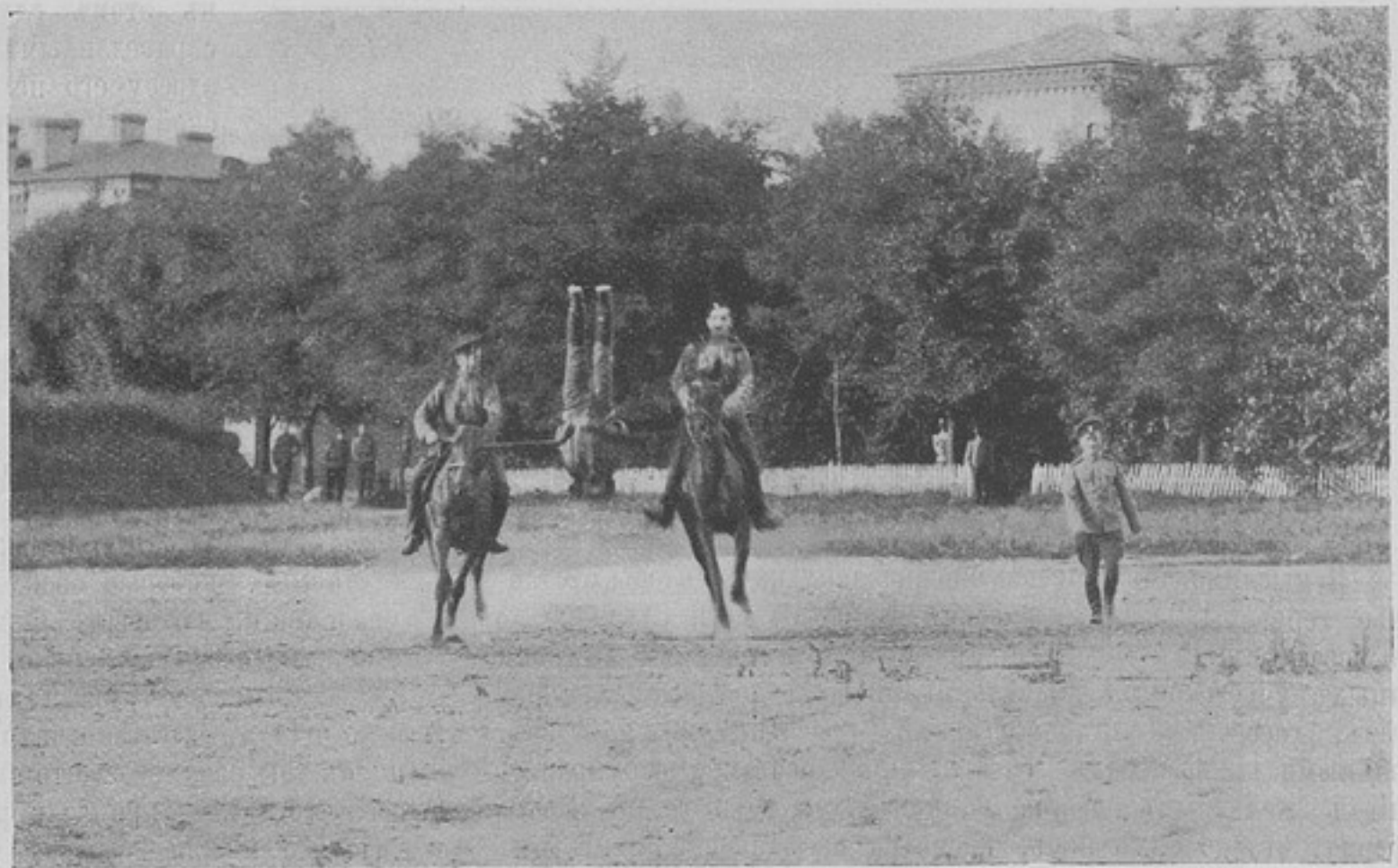
Конный праздникъ въ 4-мъ уланскомъ Харьковскомъ полку въ день столѣтія сраженія у Нацбаха. (Къ корресп. „Бѣлостокъ“).

и всё прочее,—не войны, носящие теперь наплечные знаки, какие бы то ни было, должны ихъ снять, а всё отличительные признаки своихъ чиновъ и вѣдомствъ носить на воротникахъ, стоячихъ и отложныхъ. Долой со всѣхъ лицъ не воинскаго званія и кителя защитнаго цвѣта, и пальто офицероподобное, и знаки съ околышей фуражекъ, напоминающие офицерскую кокарду. Вѣдь были уже разъ Высочайше запрещены кителя защитнаго цвѣта чиновникамъ гражданскимъ и студентамъ, а между тѣмъ то и дѣло видишь и на улицахъ, и въ общественныхъ мѣстахъ студентовъ, да и чиновниковъ въ кителяхъ офицерскаго образца. Чѣмъ это объяснить? Чѣмъ объяснить, что Высочайшая воля такъ нагло и на глазахъ всѣхъ игнорируется? Рѣшеніе этого вопроса можетъ быть дано