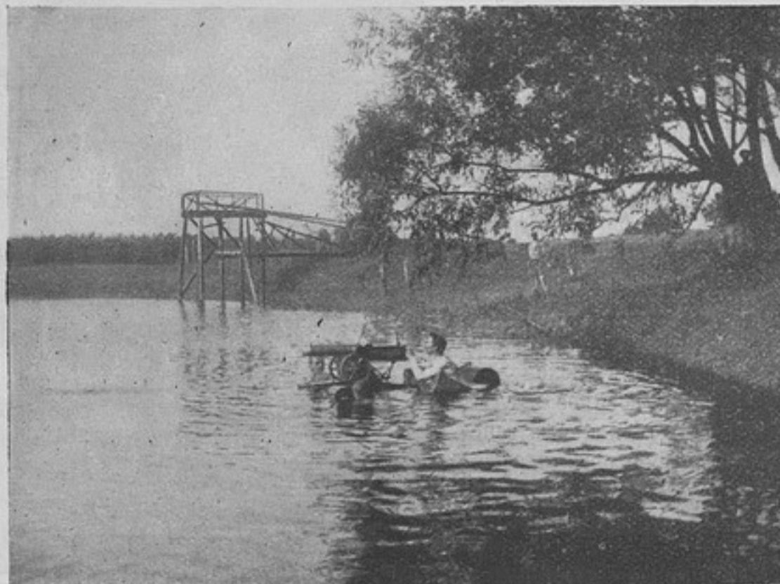
Съ плавающего пулемета открыть огонь. (Къ ст. „Пулеметь на водѣ“).