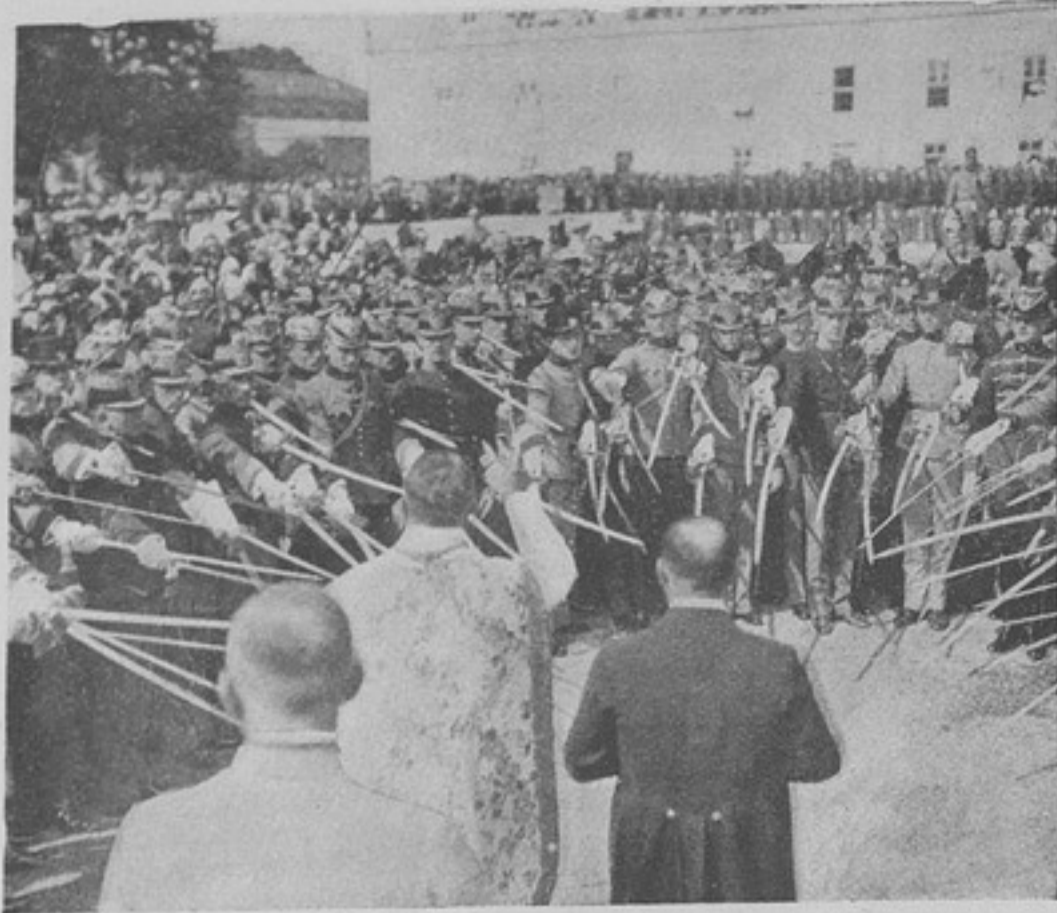
Вновь выпущенные изъ военного училища австрійскіе офицеры присягаютъ на вѣрность службы.

ніяхъ, не давшей, то трудно допустить, чтобы отъ этого не опустились руки и служащій не подумалъ: «Богъ знаетъ, и меня, быть можетъ, въ отставкѣ, ждетъ такая же участь, какъ отбывшаго турецкую войну, поберегу-ка я себя, позабочусь самъ побольше о себѣ, разъ такая въ военной службѣ несправедливость!»