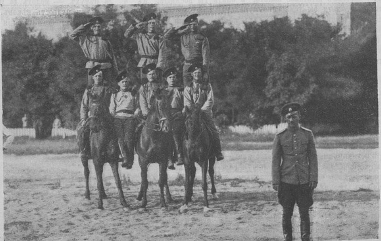
Конный праздникъ въ 4-мъ уланскомъ Харьковскомъ полку въ день столѣтія сраженія у Нацбаха. (Къ корресп. „Бѣлостокъ“).

Еще разъ скажу: цвѣтныя подкладки должны быть исключительнымъ отличіемъ генеральскихъ чиновъ воинскихъ , носимы повседневно только генералами дѣйствительной службы, а отставными генералами въ исключительныхъ и строго опредѣленныхъ случаяхъ; отставнымъ штабъ и оберъ-офицерамъ форму разрѣшить надѣвать въ тѣ же дни, что и генераламъ. Это сказано людьми высоко, въ военномъ дѣлѣ, компетентными и возраженію не подлежитъ.