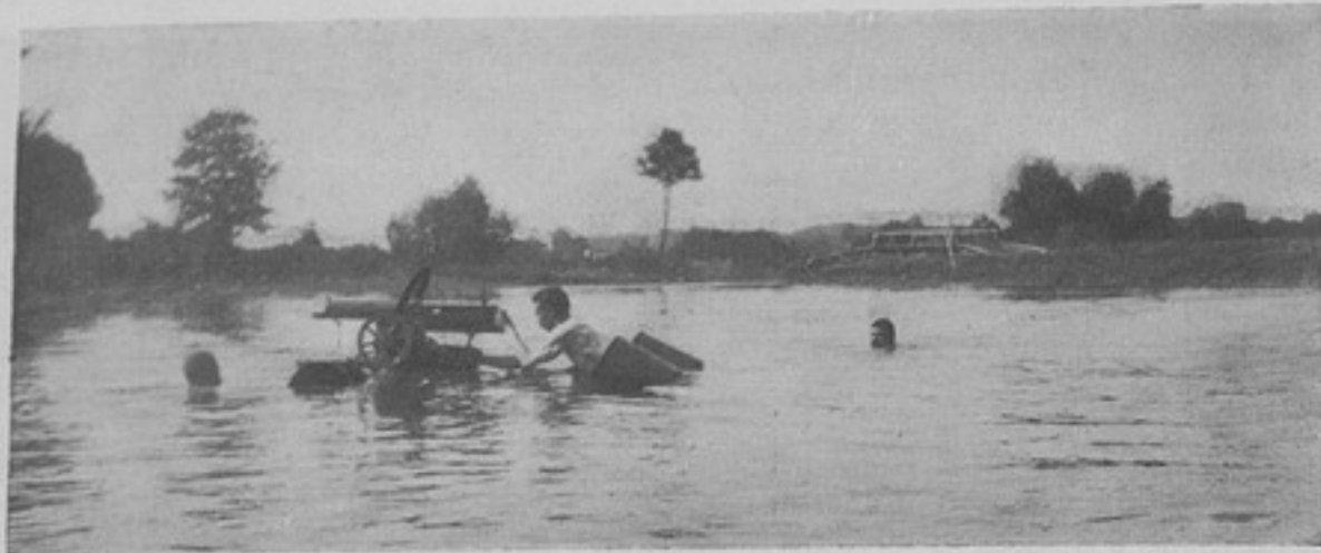
Пулеметь на водѣ. (Къ ст. „Пулеметь на водѣ“).

Немыслимо также и невозможно допускать, чтобы отставные генералы, штабъ и оберъ-офицеры, неся службу: по выборамъ ли, въ городской ли думѣ, въ земскихъ ли, или иныхъ учрежденіяхъ, начальниками желѣзнодорожныхъ бригадъ, городскими ли комиссарами, проводниками поѣздовъ, чайными контролерами, базарными старостами, въ управленіяхъ желѣзныхъ дорогъ, банкахъ и т. д. и т. д. носили форму, что до сихъ поръ, несмотря на запрещеніе, практикуется. Нельзя допускать, чтобы отставные офицеры ѣздили въ формѣ въ вагонахъ 3-го класса или заходили въ буфеты этого класса. Надо это все, безповоротно, прекратить разъ навсегда, прекратить драконовскимъ закономъ, а нежелающихъ ему подчиниться — лишать мундира. Чиновниковъ и студентовъ, не снявшихъ офицероподобнаго платья, задерживать и отправлять, для вразумленія и воздѣйствія, по начальству, а въ случаѣ повторенія — исключать.