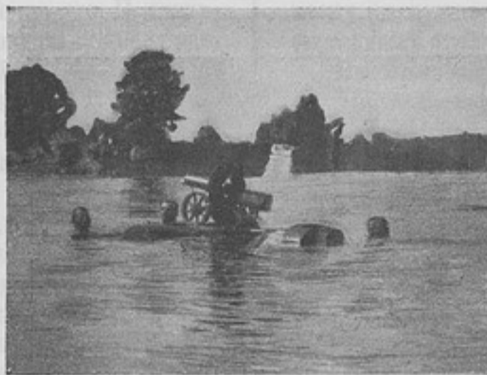
Передача пулемета. (Къ ст. „Пулеметь на водѣ“).

500 рублей на заведеніе верхняго штатскаго, для различныхъ временъ года, платья. Второе: оно должно сравнить всѣхъ, безъ изъятія, георгиевскихъ кавалеровъ въ правахъ, а не давать преимуществъ кавалерамъ войны Японской. Нельзя здѣсь ссылаться на возрастъ: есть много старшихъ бодрѣе, жизнерадостнѣе и работоспособнѣе младшихъ. «Старъ да пѣтухъ, — молодъ да протухъ». Въ пословицахъ народа правда и мудрость вѣковъ. Третье: сравнить пенсіей всѣхъ отставныхъ, безъ дѣленія на вышедшихъ въ отставку 1-го