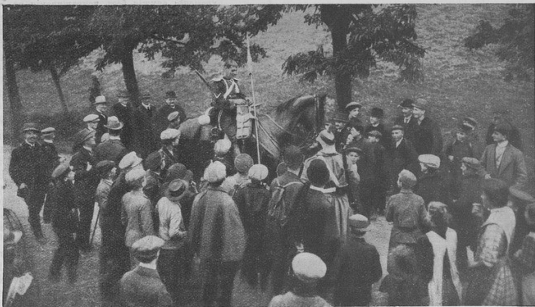
Сцена изъ маневренной жизни въ Гермакии. Взятый въ плѣнь уланъ снимаетъ чехоль съ своей каски въ знакъ плѣненія.

января 1909 г. и до, безъ выдѣленія пострадавшихъ въ Японскую войну.