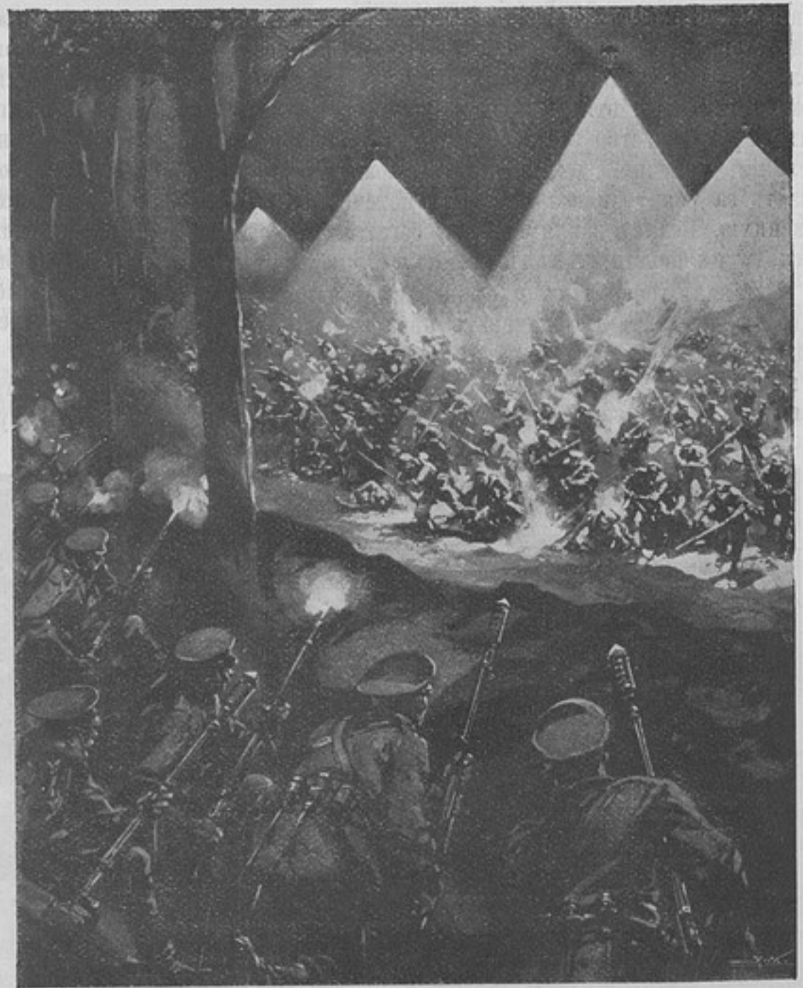
Въ недалекомъ будущемъ. Парашютныя гранаты освѣщаютъ атакующія войска. Граната имѣетъ дальность до 1,400 шаговъ. Сила свѣта гранаты — 2,500 свѣчей; продолжительность горѣнія 30 — 45 сек., въ зависимости отъ размѣра.

Уставъ ли въ коемъ случаѣ не долженъ заключать въ себѣ неясности, и тѣмъ болѣе — недоговоренности.