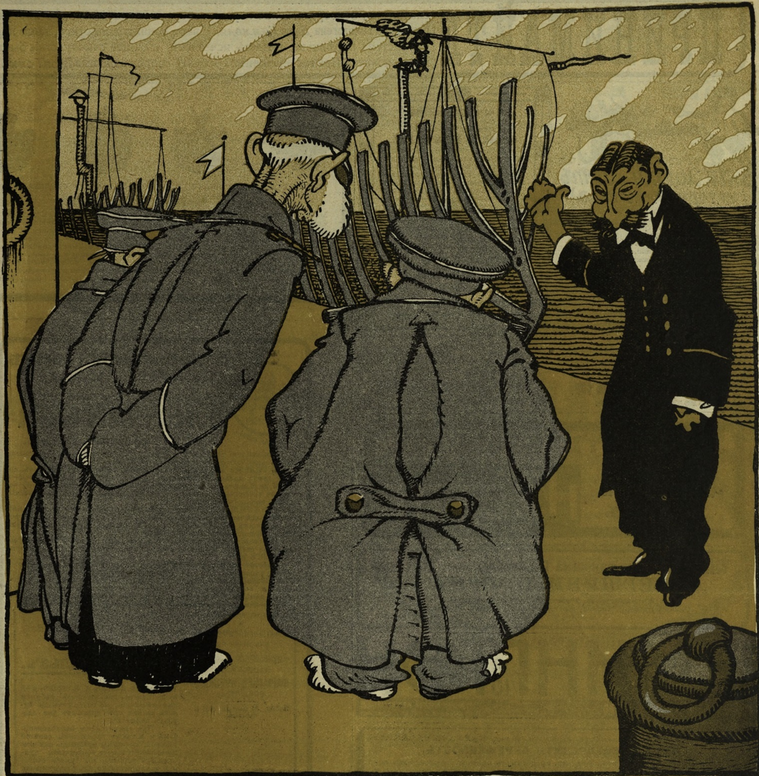
Морской инженеръ.—Вотъ, господа, я получилъ на постройку этого судна семь миллионъ—и вы видите: и его изготовилъ за эту самую цѣну!

НА СТРАСТНОЙ НЕДЕЛѢ ОТКРЫВАЕТСЯ ВЪ МОСКВѢ