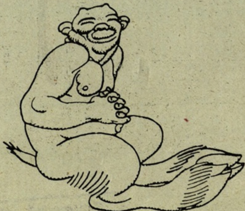
Рис. А. Я.