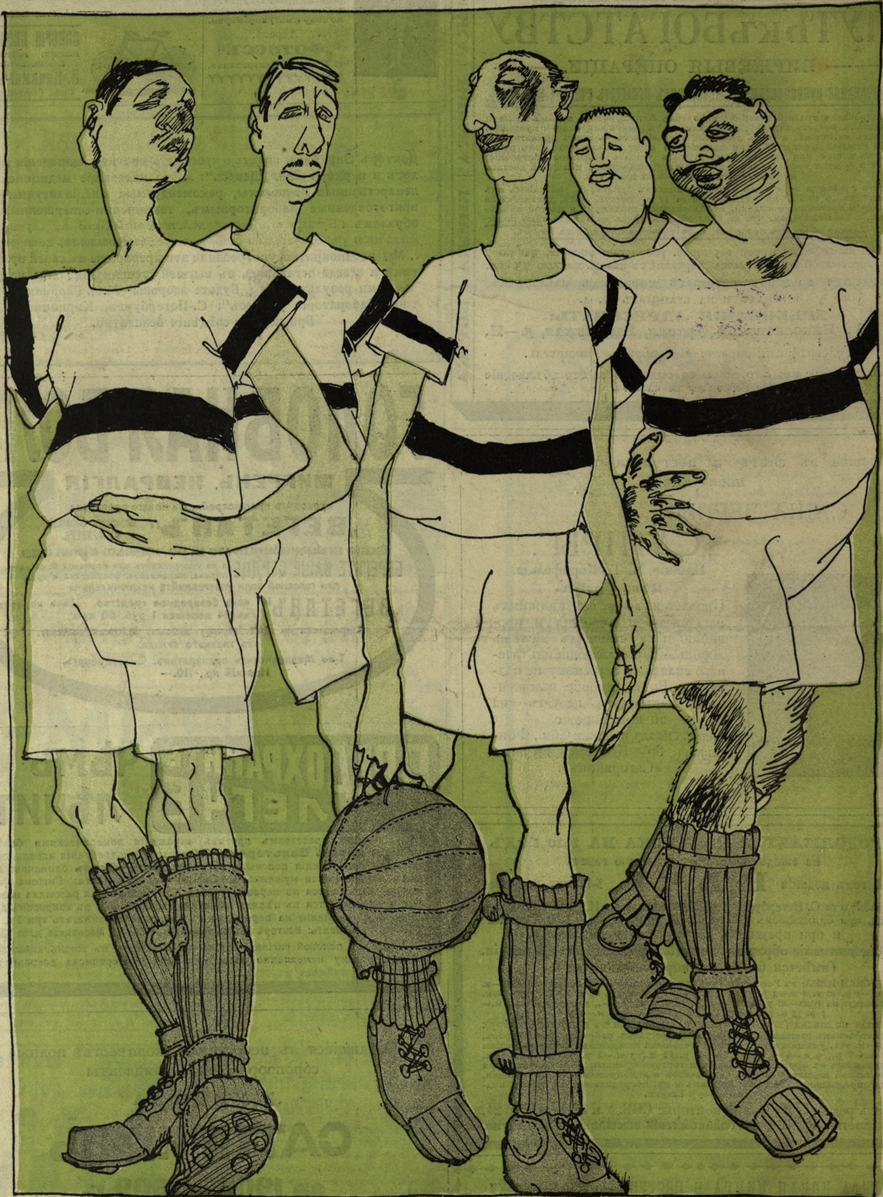
Рис. А. Яковлева.