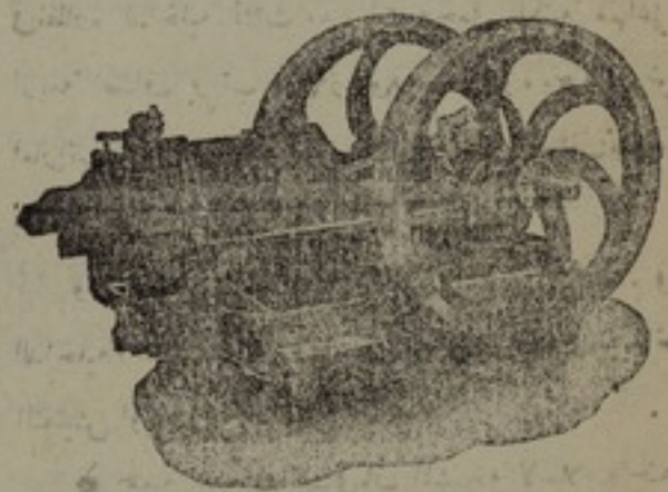
CRUDE OIL ENGINES

ماكينات الغاز سيمى ديزل، من الطرز الجديد تشتغل بغاز المصفي والغير المصفي ونقط قيارة ومندلى ودوز خورمانو